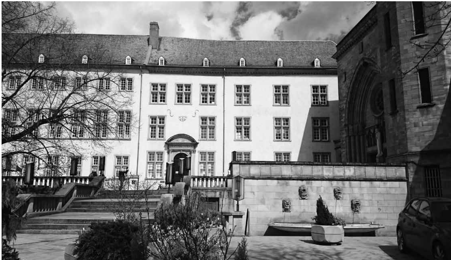
Ein Sommer der Literatur: Im Hof der ehemaligen Nationalbibliothek in Luxemburg-Stadt gibt es von Mitte August bis Mitte September eine Freiluftbibliothek und thematische Lesungen für Kinder und Erwachsene.