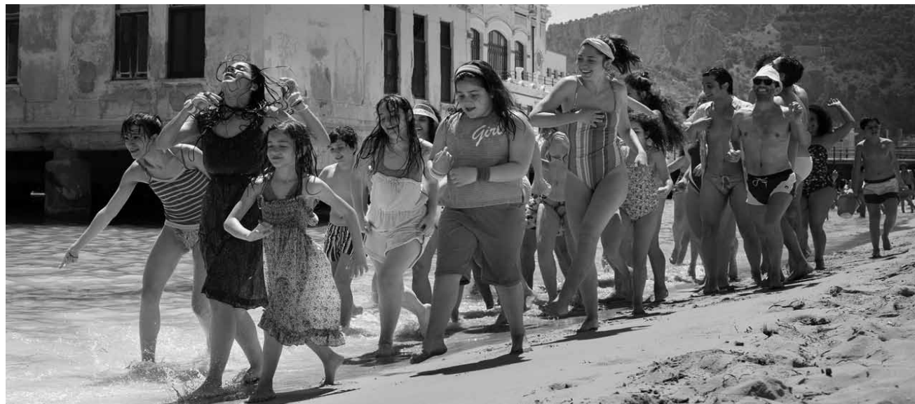
La réalisatrice Emma Dante observe « Le sorelle Macaluso » de leur enfance jusqu'à leurs vieux jours - une histoire de famille à Palerme. À l'Utopia.

Thelma hat in ihrem Hausfrauendasein nichts zu lachen, und Louise kommt in ihrem Leben als Kellnerin auf keinen grünen Zweig. Um sich von ihren privaten Sorgen und Problemen zu distanzieren entschließen sich die beiden im Grunde ziemlich ungleichen Frauen gemeinsam in den Urlaub zu fahren, fern von ihren Männern und anderen Unterdrückern.