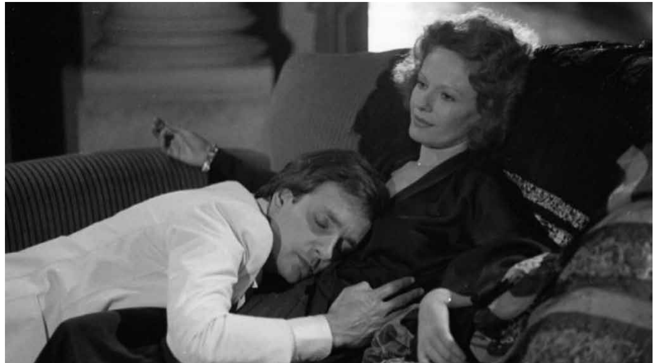
Delphine Seyrig joue Anne-Marie Stretter, l'épouse de l'ambassadeur de France à Calcutta, qui disparaît mystérieusement : « India Song ». À la Cinémathèque, le 4 août à 19h.

USA 1996 von Lana et Lilly Wachowski. Mit Gina Gershon, Jennifer Tilly und Joe Pantoliano. 109'. O.-Ton + fr. Ut.