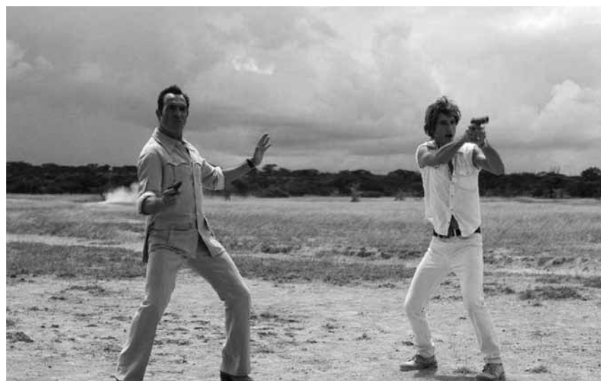
Dans « OSS 117 : Alerte rouge en Afrique noire » deux agents sont sensés prévenir une révolution. Au Kinopolis Belval et Kirchberg ainsi qu'au Waasserhaus.

Ils ont été appelés en Algérie au moment des « événements » en 1960. Deux ans plus tard, Bernard, Rabut, Février et d'autres sont rentrés en France. Ils se sont tus, ils ont vécu leur vie. Mais parfois, il suffit de presque rien, d'une journée d'anniversaire, d'un cadeau qui tient dans la poche pour que, quarante ans après, le passé fasse irruption dans la vie de ceux qui ont cru pouvoir le nier.