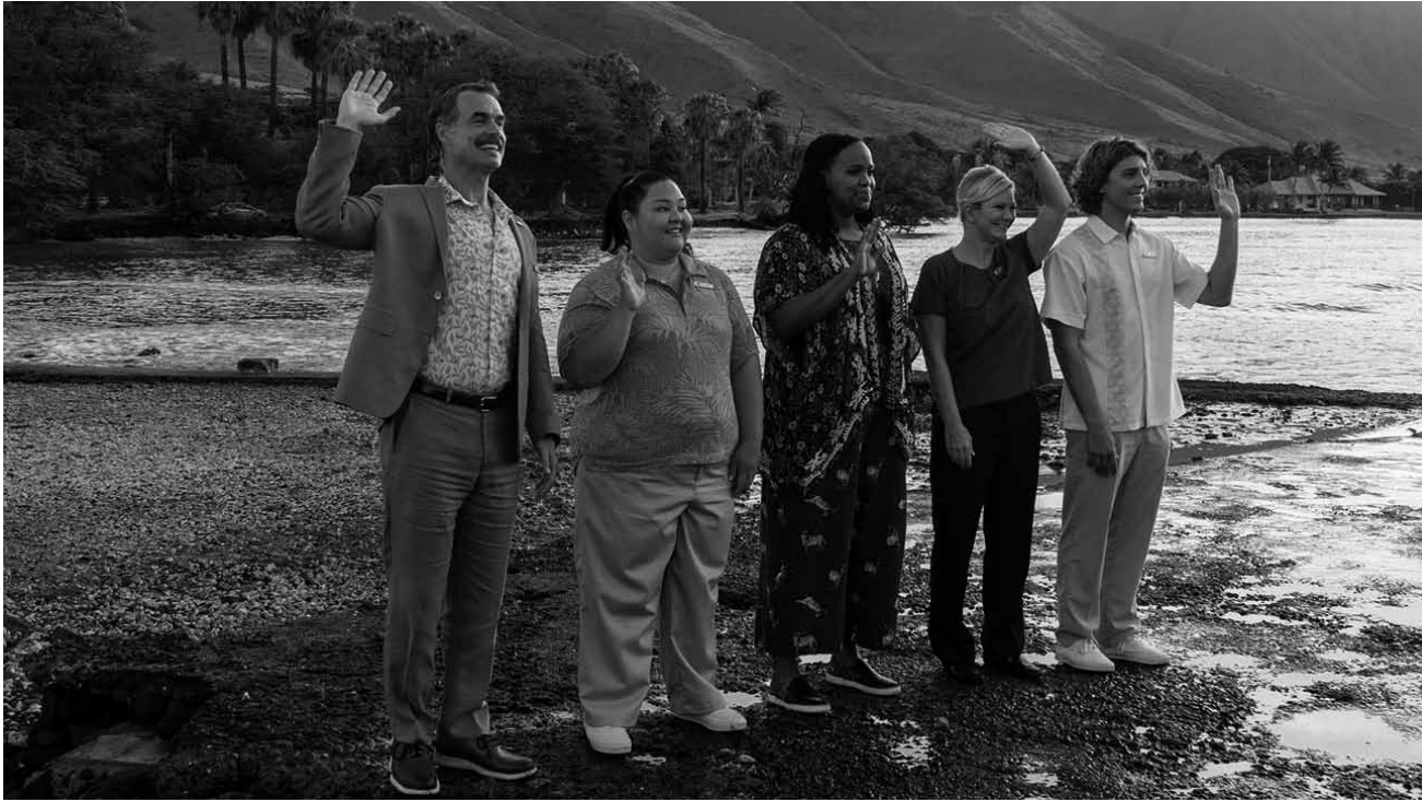
„Smile like you mean it“: Das Personal des „The White Lotus“-Resorts empfängt die neuen Gäste am Strand von Hawaii.