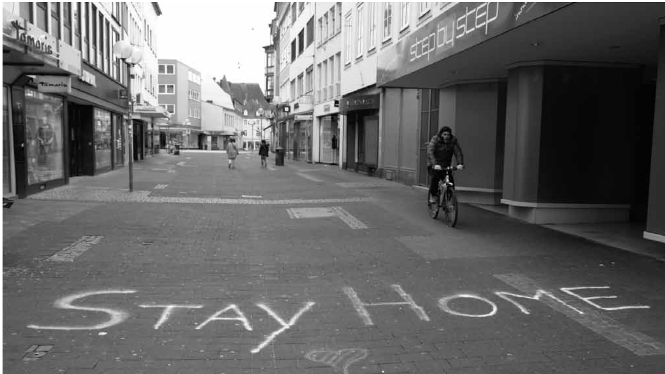
Die Mitgliederausstellung 2021 der Fotografischen Gesellschaft Trier steht unter dem Thema „Fotografieren in Zeiten von Corona – Motive vor und hinter der Haustür“ und ist bis zum 10. Oktober in der Tufa Trier zu sehen.