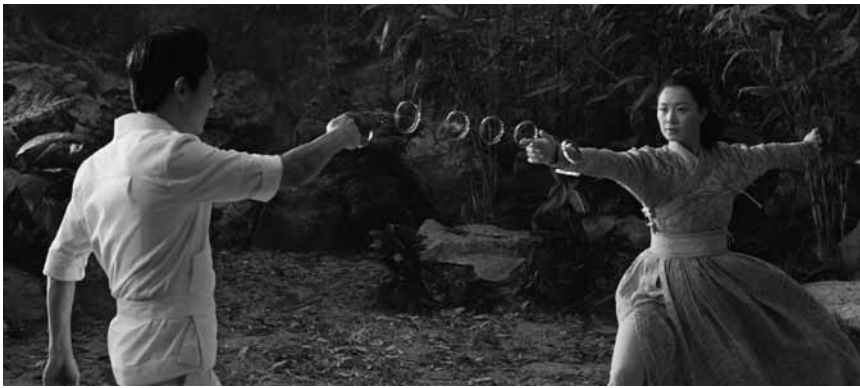
Ein Kämpfer, der seine Martial Arts Talente für das Gute einsetzen möchte: „Shang-Chi and the Legend of the Ten Rings“. Neu in fast allen Kinos.

die Schönheit und der Charme von Spanien sowie die Fantasie der Filme. Sie hat eine Affäre mit einem brillanten französischen Regisseur, er verliebt sich in eine wunderschöne spanische Frau, die dort lebt. X De bonnes idées dans cet hommage appuyé, scènes reconstituées à la sauce Allen comprises, à Godard, Fellini, Welles ou Bergman... mais aussi un certain manque de liant et de rythme qui en fait un opus mineur. (ft)