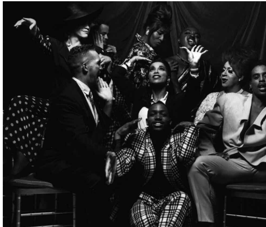
„Paris Is Burning“ beschrieb zum ersten Mal die Ball Culture in New York City der 1980er-Jahre. Die Doku läuft am Freitag, dem 20. Mai, um 20:45 Uhr in der Cinémathèque.

« Cher journal, il y a une chose que j'aime faire plus que tout... » : c'est ainsi que l'auteur commence ses