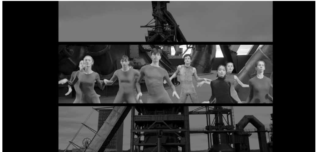
Des hauts fourneaux au Mudam ? Oui, dans l'expo multidisciplinaire « Deary Steel » de Cecilia Bengolea. À partir de ce samedi 14 mai, jusqu'au 29 mai.