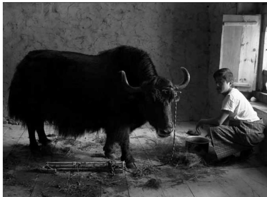
Ein Sänger, der von der weiten Welt träumt, findet sein Glück im idyllischen Buthan: „Lunana: A Yak in the Classroom“. Der oscarnominierte Film läuft neu im Utopia.

Mit einem Visa ins weit entfernte Australien und eine Karriere als Sänger starten - das ist Ugyens Traum. Doch