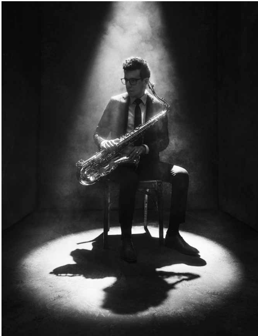
Le Cube 521 à Marnach a invité Oded Tzur pour une session de jazz, le 21 mai à 20h.

Buntes Republik , Unterhaltungsstück in Schwarz/Weiß von Ulf Dietrich und Manfred Langner, Theater Trier, Trier (D), 19h30. Tél. 0049 651 7 18 18 18. www.theater-trier.de