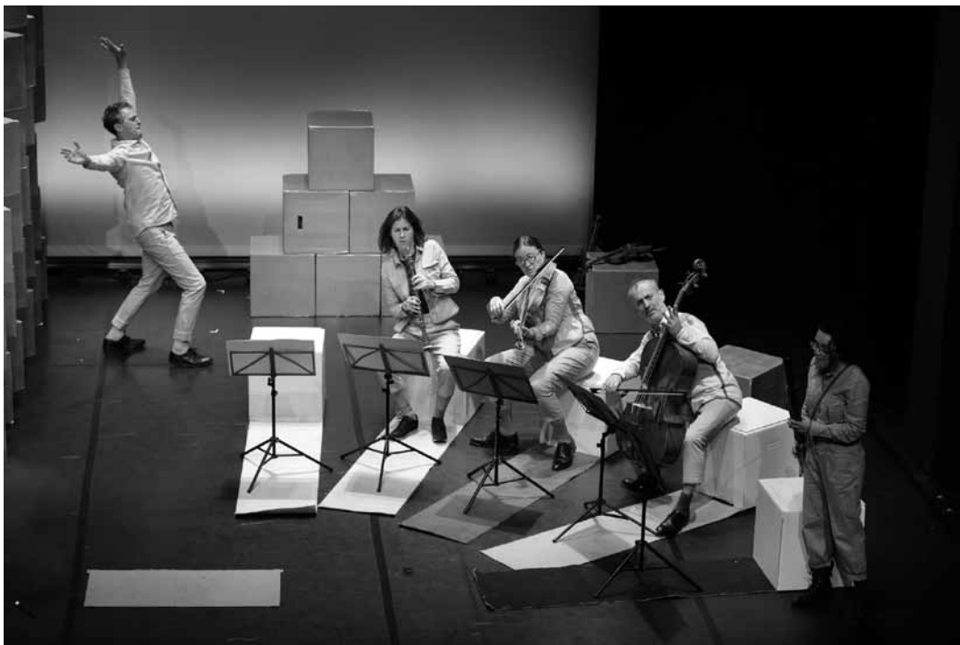
Die Musiker*innen des Ensemble Traffik Theater sorgen am 20. November ab 15 Uhr mit dem dynamischen Musiktheater für Kleinkinder „Ding, Dong, Toktoktok!“ für Bewegung im Echternacher Trifolion.

Paysage en tissu , atelier (6-12 ans), Casino Luxembourg - Forum d'art contemporain, Luxembourg , 15h. Tél. 22 50 45. www.casino-luxembourg.lu