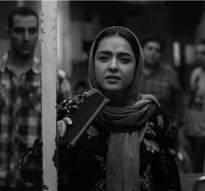
Dans « Leila's Brothers », l'héroïne élabore une stratégie pour sauver sa famille lors d'une importante crise économique. Nouveau à l'Utopia.

Body Snatchers USA 1993 von Abel Ferrara. Mit Gabrielle Anwar, Terry Kinney und Billy Wirth. 87'. O.-Ton + fr. Ut. Mi, 16.11., 18h30. Steve Malone zieht mit seiner Familie für einen Sommer lang auf eine Militärbasis, um dort für die Beseitigung von chemischen Waffen zu sorgen. Schon bald jedoch fällt ihnen auf, dass sich die Soldaten immer merkwürdiger verhalten. Und tatsächlich befinden sie sich inmitten einer Invasion außerirdischer Körperfresser, die menschliche Wesen im Schlaf