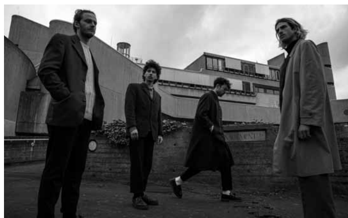
Le groupe indie rock luxembourgeois Tuys présente son nouvel album « Reality Management Ltd. » à la Kulturfabrik Esch, ce vendredi à partir de 20h30.