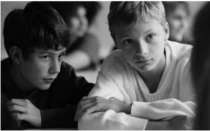
Deux garçons que l'adolescence qui vient sépare vont chercher à se retrouver dans « Close », le nouveau film de Lukas Dhont. Dans les cinémas régionaux.

empli d'émotions, il est temps de préparer l'avenir au-delà du lycée. Fûtarô prend petit à petit conscience de ce qu'il ressent pour chaque sœur.