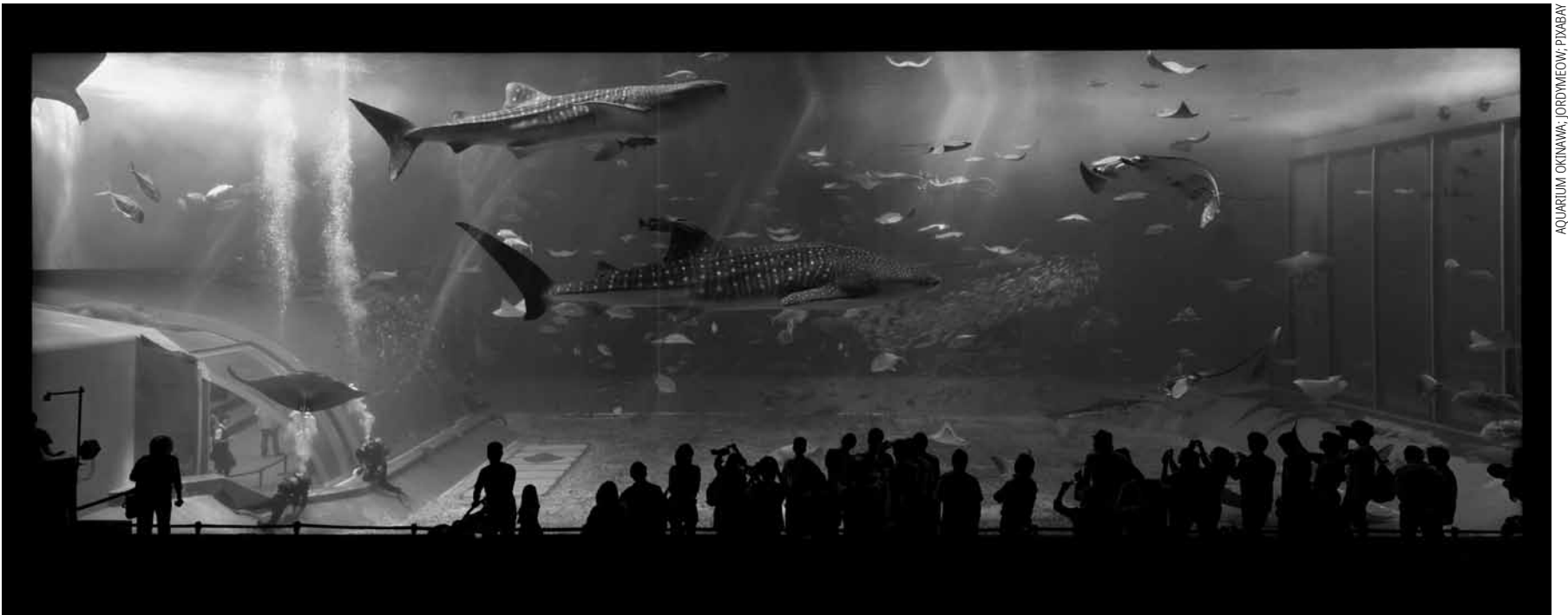
AQUARIUM OKINAWA

Die Haifische bleiben unter sich, die kleinen Fische und die Zivilgesellschaft schauen zu.