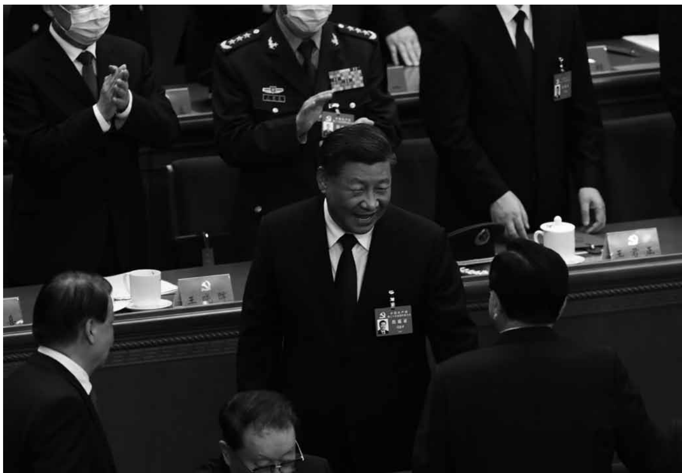
Bei der Wahl für den siebenköpfigen Ständigen Ausschuss des Politbüros der KPCh scheint es Generalsekretär Xi Jinping gelungen zu sein, ausschließlich treue Gefolgsleute einzusetzen.

die „Landsleute“ auf Taiwan gerichtet, sondern nur gegen wenige „Separatisten“ und „ausländische Kräfte“, die intervenieren wollten. Das ist eine indirekte Warnung an die US-Regierung, die zwar formal weiter an dem „Ein-China-Prinzip“ festhält, das die Regierung von Jimmy Carter 1979 festgeschrieben hatte, und damit die Regierung in Beijing als einzige legitime Vertretung des Landes anerkennt. Gleichzeitig hat US-Präsident Joe Biden seit seinem Amtsantritt unter dem Motto der „strategischen Ambiguität“ die halboffiziellen diplomatischen und militärischen Beziehungen zur Regierung der Republik China (Taiwan) deutlich aufgewertet; eine Ambiguität, die in den USA sogar gesetzlich festgeschrieben ist, durch die Selbstverpflichtung der USA im „Taiwan Relations Act“, ebenfalls von 1979, Taiwan mit Waffen zur Verteidigung auszustatten. Bidens Haltung in diesem schon lange bestehenden Zwiespalt interpretiert die KPCh als Provokation und Bruch bestehender völkerrechtlich bindender Verträge zwischen der Volksrepublik und den USA.