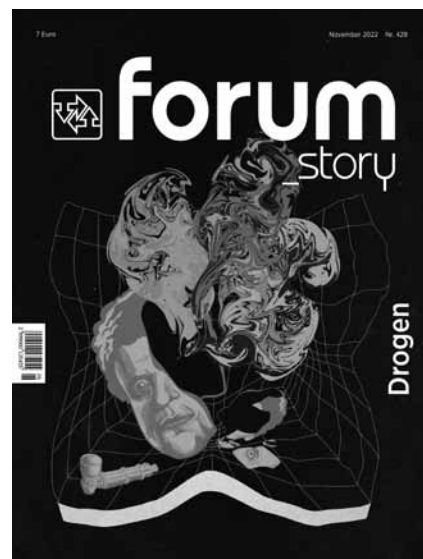
Das Cover wurde von Ruth Lorang gestaltet.

rin Rebecca Baden verantwortlich ist, macht auf jeden Fall Lust auf mehr. In vier Kapiteln erzählt Baden über Drogenabhängigkeit in der Politik, die Beratungs-, Hilfs- und Therapiestrukturen für Drogenabhängige und die Schwierigkeiten einer liberalen Drogenpolitik. Ein Glossar mit einigen Begriffserklärungen rundet das Dossier ab. Der Blick auf Drogen ist eher problematisierend: Es geht viel um Ab-