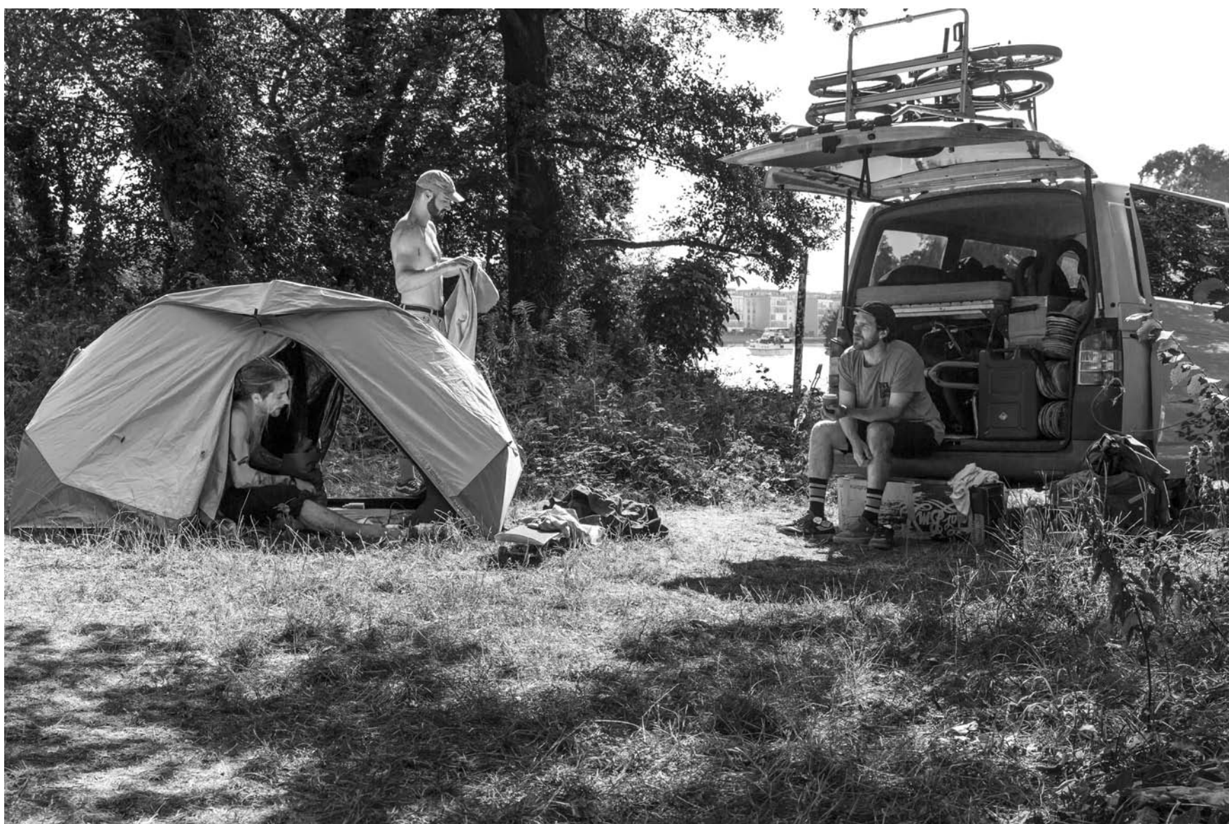
Temps calme au bord de la rivière Spree. L'équipe se repose avant d'effectuer un voyage express de quatre jours, dont deux sur les routes, pour atteindre Lviv en Ukraine. Quant à Yurii, il retournera à Hanovre, où il habite, afin de continuer à donner des cours de skateboard aux jeunes réfugié-es ukrainien-nes au skatepark Gleis D. Berlin, Allemagne - 8.8.2022