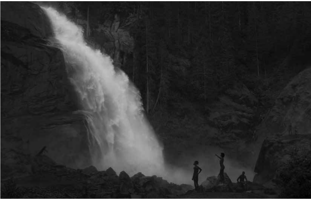
Das Musée national d'histoire et d'art in Luxemburg-Stadt stellt vom 16. Dezember bis zum 11. Juni von Edward Steichen inspirierte Fotografien von Erwin Olaf und Installationen von Hans Op de Beeck aus.

Programmation Zoom In : Exploration sensorielle , visite guidée