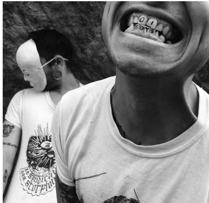
Oi Boys, Post-Punk Duo aus Metz, spielt am 15. Dezember, um 20 Uhr in den Rotondes in Luxemburg-Stadt – mit Support von Lawn Chair.