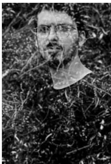
Du jazz à Neimënster : Vaague – Klein – Herr Bender y joueront le 15 décembre à 20h.

Hänsel und Gretel , mit dem Conservatoire du Nord, Centre des