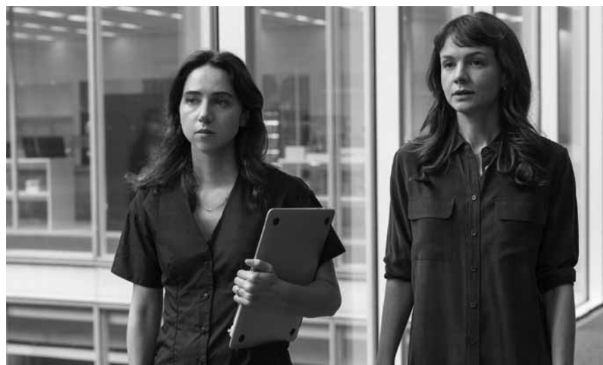
In sachlich-nüchternem Ton erzählt „She Said“ davon wie Megan Twohey und Jodi Kantor ihren Recherchen nachgingen.

Genau wie die Opfer nicht auf diesen Status reduziert werden, so sind auch Twohey (Carey Mulligan) und Kantor (Zoe Kazan) auch mehr als nur fleißige Bienchen. Ihre Suche nach Zeug*innen, die bereit sind „on the record“ auszusagen, verläuft alles andere als reibungslos: Manche Opfer verweigern aufgrund von Geheimhaltungsvereinbarungen mit Weinstein das Gespräch von vorneherein, andere ziehen ihr Kooperationsangebot nachträglich zurück. Die Journalistinnen erhalten jederzeit Anrufe, auch in ihrer Freizeit, und müssen zum Teil aus dem Stegreif mit größtem Fingerspitzengefühl auf die Person am anderen Ende der Leitung reagieren. Dass der