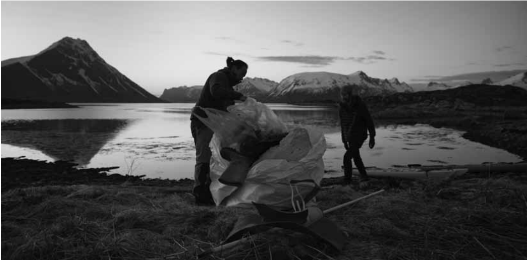
„The North Drift – Plastik in Strömen“, eine Doku über Plastikverschmutzung läuft ab jetzt in den regionalen Kinos.

(Millenium Actress) J 2001, film d'animation de Satoshi Kon. 87'. V.o. + s.-t. fr. Di, 13.12., 20h30. Chiyoko Fujiwara, ancienne gloire du cinéma japonais, vit recluse chez elle. Un journaliste, fervent admirateur, vient l'interviewer sur son passé et lui