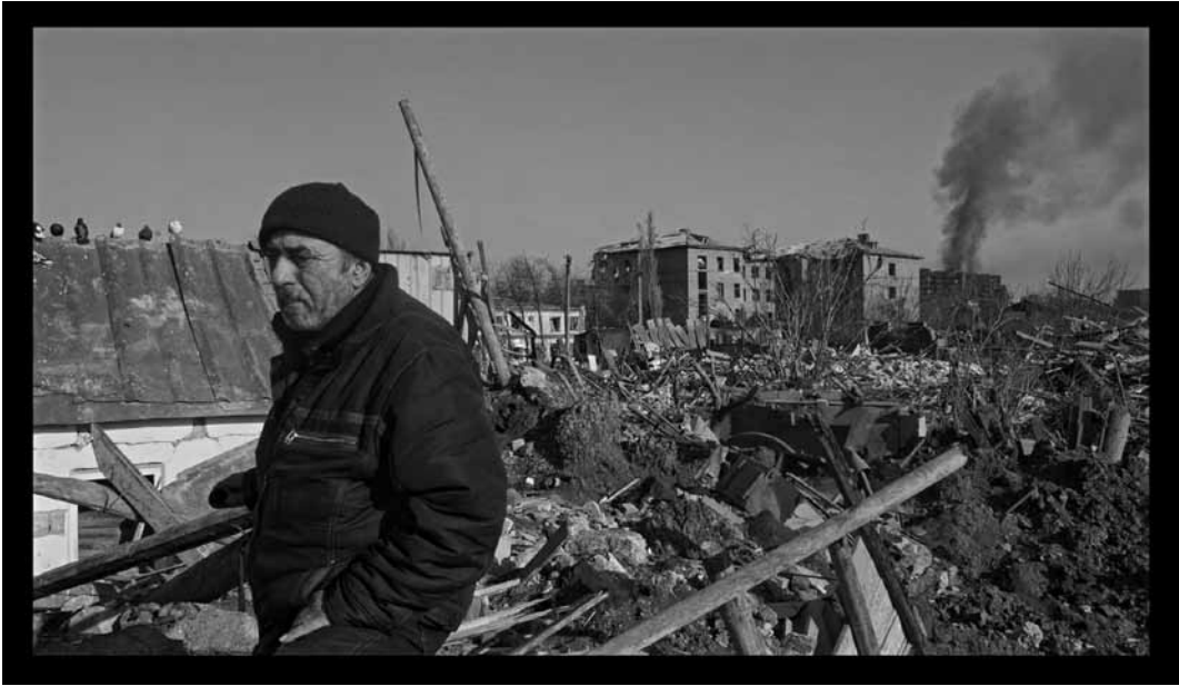
« Mariupolis 2 » documente le voyage qui a coûté la vie au réalisateur Mantas Kvedaravičius, au cœur de la guerre en Ukraine en 2022. À la Cinémathèque, le 6 février à 20h30.

USA 1978 von David Lynch. Mit Jack Nance und Charlotte Stewart. 89'. O.-Ton + fr. Ut. Di, 7.2., 18h30. Henry Spencer, glückloser Fabrikarbeiter in einer trostlosen Industrielandschaft, sieht sich mit den Schrecken der Vaterschaft konfrontiert. Nach einer viel zu kurzen Schwangerschaft bringt seine Ex-Freundin Mary ein grässlich entstelltes Kind zur Welt, das die Mutter mit seinen Schreien derart überfordert, dass sie beschließt, Henry mit dem Neugeborenen alleine zurückzulassen. Henrys Trip in Richtung Wahnsinn und Paranoia nimmt seinen Lauf.