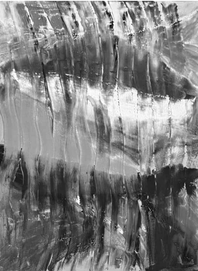
Au programme du Kulturhaus Niederaanven jusqu'au 24 février : les peintures de Jacqueline Theresia Petersen.

Sung Tieu sculptures, Musée d'art moderne Grand-Duc Jean (3, parc Dräi Eechelen. Tél. 45 37 85-1), jusqu'au 5.2, ve. - di. 10h - 18h.