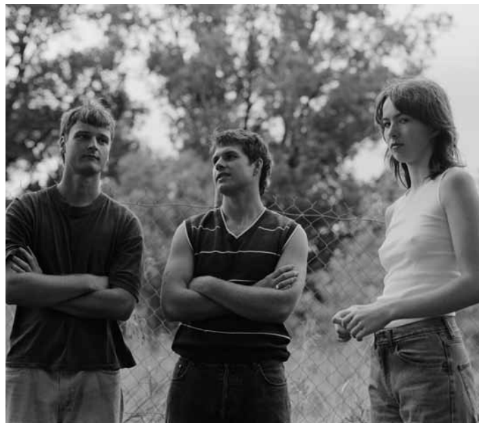
Ce samedi 4 février, il y aura du punk aux Rotondes avec Clamm, à partir de 20h.

The Horse Blinders , blues, Ancien Cinéma Café Club, Vianden, 20h. Tel. 26 87 45 32. www.ancien cinema.lu