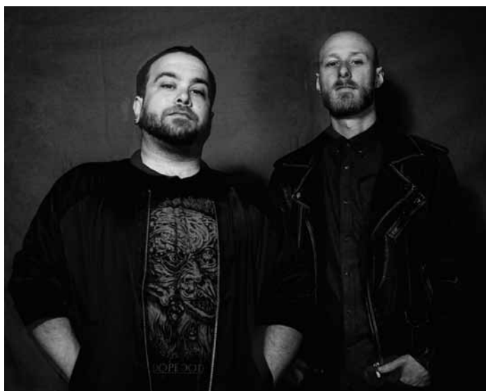
Keine fliegenden Holländer, sondern das Rap/Rock-Duo Dontnod tritt an diesem Freitag, dem 16. Juni um 21 Uhr in Beaufort im Flying Dutchman auf.