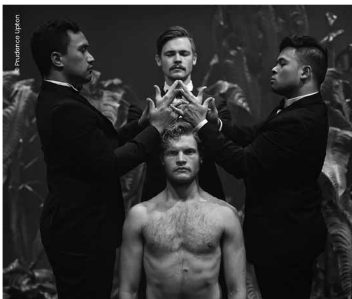
« King » : une chorégraphie de Shaun Parker à découvrir mardi 20 et mercredi 21 juin à 20h, au Grand Théâtre à Luxembourg-ville.

Paul oder im Frühling ging die Erde unter , Monolog von Sibylle Berg, inszeniert von Lucia Reichard, mit Bernd Geiling, Historisches Museum Saar, Saarbrücken (D) , 19h. Tel. 0049 681 5 06 45 01. staatstheater.saarland