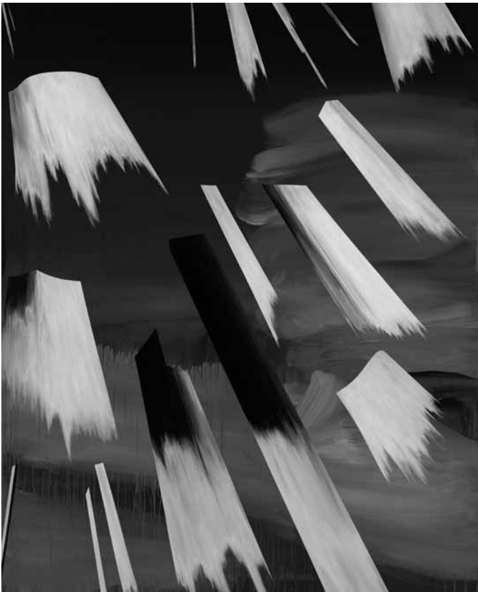
La Konschthal à Esch rouvre ses portes avec « Flying Mercury », expo de l'artiste peintre Tina Gillen. Du 3 juin jusqu'au 12 novembre.

LUXEMBOURG A Room of One's Own photographies de Cansu Yildiran, Ofir Berman et Imane Djamil, Neimënster (28, rue Munster. Tél. 26 20 52-1), jusqu'au 1.6, tous les jours 10h - 18h. Dans le cadre de l'« European Month of Photography ». Awodiya Toluwani : Interwoven Existences peintures, Zidoun & Bossuyt Gallery (6, rue Saint-Ulric. Tél. 26 29 64 49), jusqu'au 27.5, ve. 10h - 18h, sa. 11h - 17h.