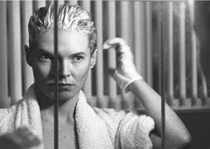
England der 1980er-Jahre: die Lehrerin Jean fühlt sich gezwungen wegen ihrer Sexualität ein Doppelleben zu führen: „Blue Jean“ – neu im Utopia.

Exhibition on Screen: Tokyo Stories GB 2023, documentary by David Bickerstaff. 90'. Ov. + st. For all. Utopia, 13.6. at 19h. Based on a major exhibition at the Ashmolean in Oxford, the documen-