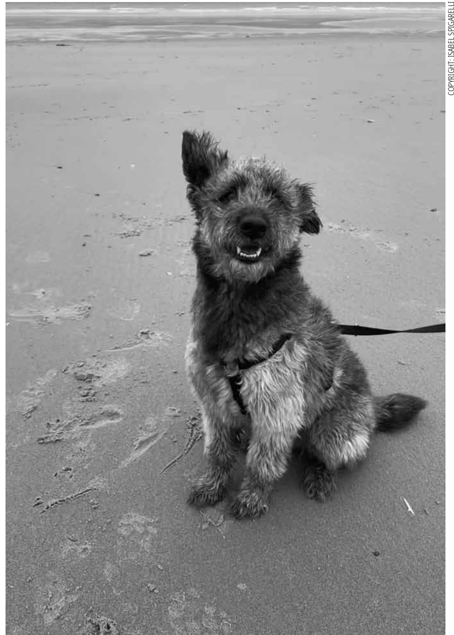
Zu welcher Postkarte dieses Urlaubsfoto beigelegt war, erfahren die Leser*innen in den kommenden Wochen auf der Rückseite der woxx.