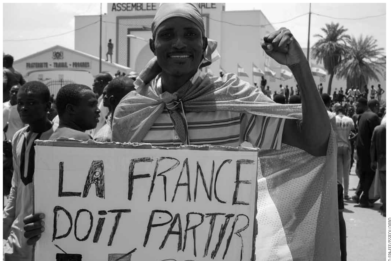
Demo in Niamey: für den Putsch und gegen Frankreich.

Wahrscheinlicher als eine Intervention Frankreichs ist ein Eingrei-