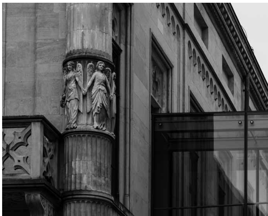
FAÇADE DE LA CHAMBRE

Un rapport inoffensif - angélisme ou complaisance ?