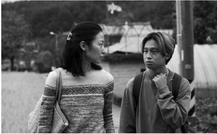
„Riceboy Sleeps“ stellt die alltäglichen rassistischen und kulturellen Herausforderungen einer alleinerziehenden koreanischen Mutter und ihres Sohnes dar. Neu im Utopia.

IND 2023 by Shiva Nirvana. Starring Vijay Deverakonda, Samantha Ruth Prabhu und Murli Sharma. 165'. O.v. + st. From 12 years old. Kinopolis Belval, 3.9 at 16h15. Jenny, a Kashmiri girl, and Shiva are college friends who fall in love and face challenges later in their relationship. The film explores themes of love, separation, and the journey to reunite against all odds.