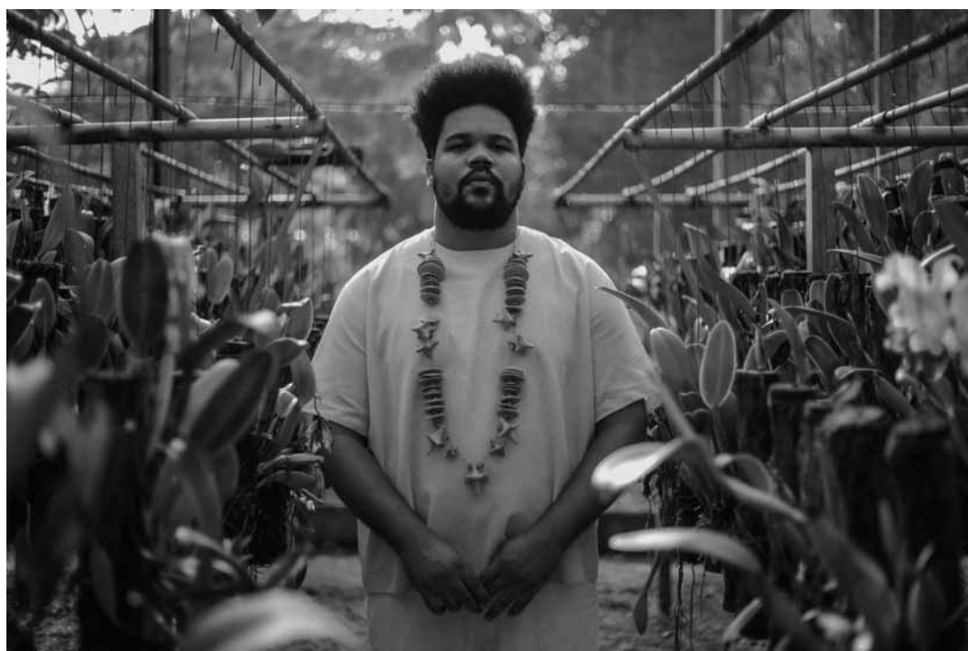
Amaro Freitas, musicien de jazz brésilien, participe au « Festival atlântico » de la Philharmonie à Luxembourg-ville, ce samedi 21 octobre à partir de 18 h.

Mondo Tasteless: Die Trashfilmreihe , sparte4, Saarbrücken (D) , 20h. Tél. 0049 681 30 92-486. www.sparte4.de