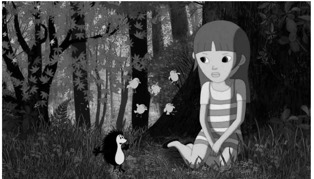
Dans le film d'animation « Nina et le secret du hérisson », Nina vit une grande aventure. Nouveau dans les salles régionales.

Antonis is a down-on-his luck attorney, but this day will be a turning point: all his relationships and commitments will be challenged and re-examined as this modern Ulysses travels from the courthouses to remote Athenian outskirts. When the new dawn breaks, he will be a changed man.