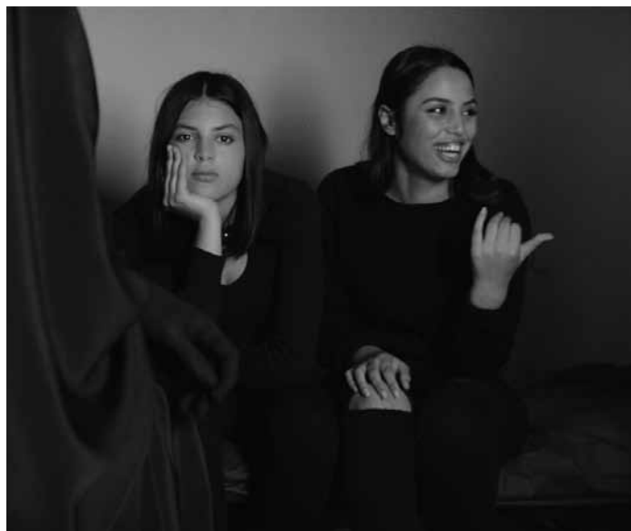
« Les filles d'Olfa » montre, entre documentaire et fiction, la radicalisation de jeunes femmes tunisiennes et les répercussions sur leurs familles. Nouveau à l'Utopia.

Im tiefsten Süden der USA in den 1930er-Jahren begibt sich der Sträfling Everett „Ulysses“ McGill mit seinen Leidensgenossen Pete und Delmer auf einen Roadtrip der besonderen Art. Ulysses überredet seine Mitgefangenen zur Flucht und verspricht ihnen einen Anteil an einem geheimnisvollen Goldschatz. Les frères Coen procèdent avec subtilité et leurs images atteignent la magie. Ce à quoi s'ajoute une musique country absolument géniale. (Germain Kerschen)