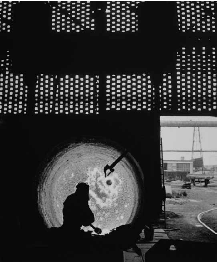
Nouvelle expo à la galerie Schlassgoart à Esch : jusqu'au 20 octobre, « Steel Life » présente la vie dans le bassin minier à travers environ 70 photographies en noir et blanc de Romain Urhausen.

Festival Clowns in Progress : Tracey Picapica installations, Ratelach - Kulturfabrik (116, rue de Luxembourg), du 20.9 au 7.10, ma. - sa. 17h - 1h.