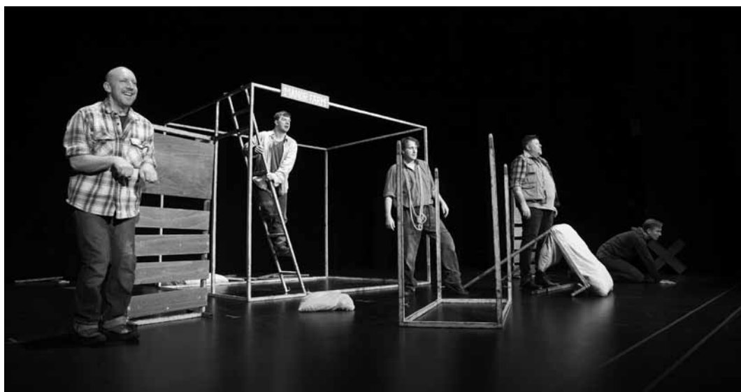
Ein Klassiker im Cube 521: „Animal Farm“ von George Orwell ist am 1. Dezember, um 20 Uhr, in Marnach zu sehen.