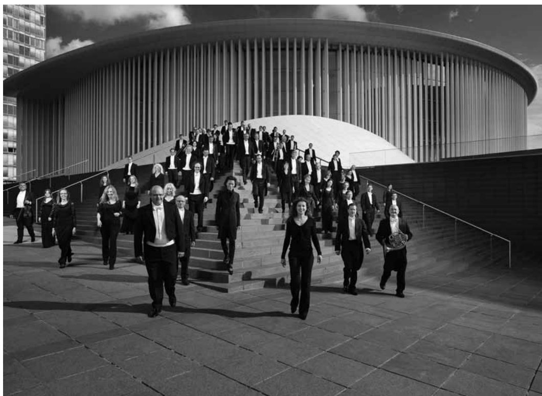
En route pour le concert de gala de SOS Villages d'enfants du monde, le 7 décembre à partir de 19h30, avec l'orchestre philharmonique du Luxembourg à la Philharmonie à Luxembourg-ville.

de Nicola Galli, au préalable conférence « Dance in Taiwan » (18h), Bananefabrik, Luxembourg , 19h.