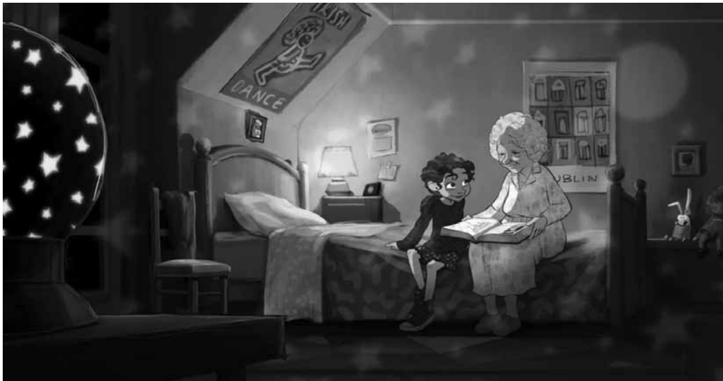
Mary begibt sich auf eine magische Reise durch ihre Familiengeschichte: „A Greyhound of a Girl“. Neu im Kinepolis Belval und Kirchberg, Scala, und Starlight.

Der New Yorker Drogenfahnder Jimmy Doyle, genannt Popeye, ist kein strahlender Held, sondern ein desillusionierter Unsympath, dem schon mal die Hand ausrutscht. Auf einer nächtlichen Zechtour durch die Speunken beginnt er mit seinem Partner Russo aus einer Laune heraus, einen Kneipengast zu beobachten. Die beiden Ermittler landen einen Volltreffer. Bei dem Mann handelt es sich um den Drogenhändler Salvatore Boca, der einen Deal mit dem französischen Drogenboss Alain Charnier aus Marseille einfädeln möchte.