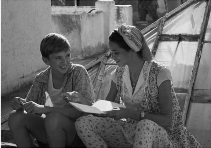
« Le petit blond de la Casbah » d'Alexandre Arcady, film sur une histoire de famille dans l'Algérie des années 1960 – nouveau au cinéma Utopia.

La Belle Noiseuse F 1991 de Jacques Rivette. Avec Michel Piccoli, Emmanuelle Béart et Jane Birkin. 239'. V.o. Di, 12.12., 18h30. En six jours, un peintre, Frenhofer, va tenter de traverser les apparences et de mettre sur toile, non les formes exquises de Marianne, mais son secret. Jeu dangereux, car c'est son âme que Marianne, un soir, découvrira incrustée dans la toile. Vision terrible dont elle ne guérira pas.