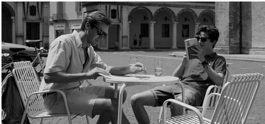
Bereits jetzt ein Klassiker queerer Filmgeschichte: „Call Me by Your Name“, am 27. Januar um 20:30 Uhr in der Cinémathèque in Luxemburg-Stadt.

Jullier (F. 60') et suivie d'une analyse du film par le conférencier. Dans le cadre de l'Université populaire du cinéma.