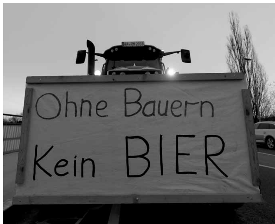
Fahren schwere Geschütze auf: Protestierende Bauern in Deutschland.

Doch auch die Sozialdemokraten und die Grünen haben sich keine agrarpolitischen Lorbeeren verdient. Denn neben der allmächtigen Lobbygang des Deutschen Bauernverbandes und der 2019 gegründeten noch konservativeren Bewegung „Land schafft Verbindung“ gibt es beispielsweise seit 1998 den „Bundesverband Deutscher Milchviehhalter“ (BDM) oder die stärker grün gefärbte kleinere „Arbeitsgemeinschaft bäuerliche Landwirtschaft“ (AbL). Insbesondere der BDM – dem in Luxemburg die „Lëtzebuerger Mëllechbauer“ entsprechen – war ein Angebot für SPD und Grüne, dem Lobbyismus der Bauern eine andere Richtung zu geben. Die beiden Parteien haben dies jedoch weder verstanden noch die Situation im landwirtschaftlichen Sektor, die jederzeit eskalieren konnte, richtig einschätzen können: Die Offerte wurde besserwisserisch zur Seite geschoben. Nun hat man den Mist. Agrarpolitik ist wie Fußball: Wenn du deine hundertprozentigen Chancen nicht nutzt, reicht ein Gegentreffer, und du gehst als Verlierer nach Hause. Jetzt müssen wir Kleingärtner wieder ran und den Schlamassel richten. Egal, Hauptsache an die Front. Da fühlen sich Deutsche wohl.