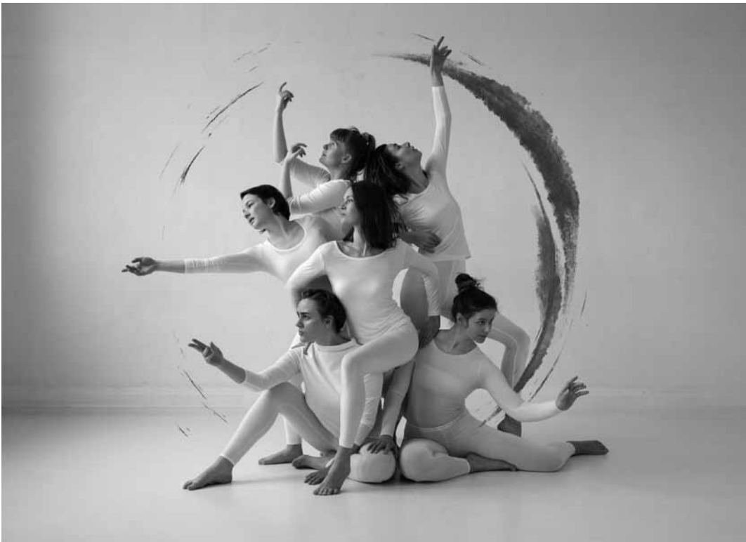
Au Festival A Cape'lla au Cape Ettelbrück : Sjaella, le 25 janvier à partir de 20h.