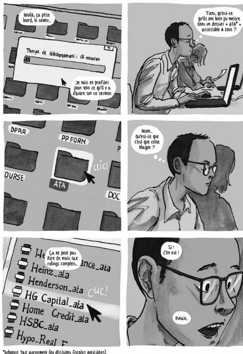
*Advance Tax Agreement (ou décisions fiscales anticipées).