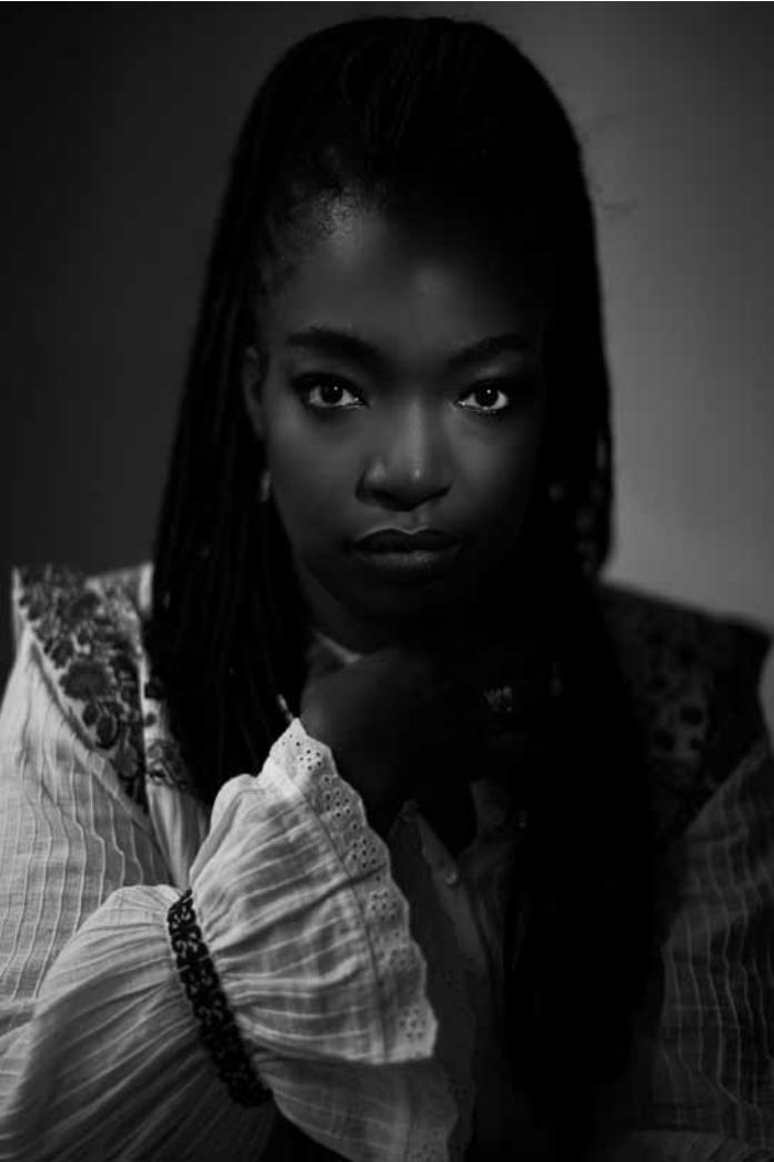
Axelle Fanyo, la virtuose du violoncelle, enchantera le public de la Philharmonie Luxembourg le 27 mars à 19h30 avec une fusion harmonieuse de musique classique et contemporaine.

Messer , Post-Punk, Dub und Reggae, sparte4, Saarbrücken (D), 20h. Tel. 0049 681 30 92-486. www.sparte4.de