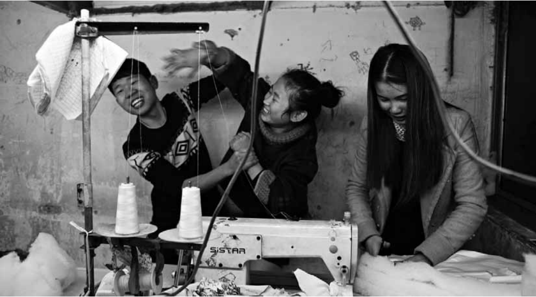
Avec le documentaire « Qingchun » le réalisateur Wang Bing se plonge dans la vie quotidienne de la jeunesse chinoise. Nouveau à l'Orion, Prabbeli, Scala, Sura et Utopia.