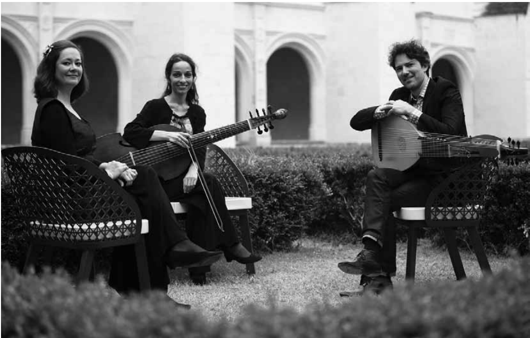
« Emotional Landscapes » offre le mardi 26 mars à 20h à l'abbaye de Neimënster une interprétation intime des mélodies de Björk et s'adresse aussi bien à ses fans qu'aux passionné-es de musique ancienne.

Staatstheater, Saarbrücken (D), 19h30. Tel. 0049 681 30 92-0. www.staatstheater.saarland