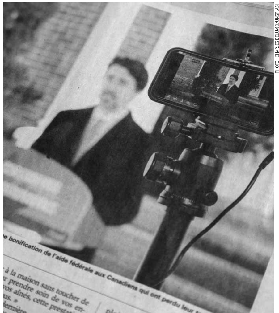
Comme plusieurs de ses prédécesseurs, l'actuel premier ministre canadien, Justin Trudeau, promet des réformes pour lutter contre l'évitement fiscal. Par le passé, ces tentatives se sont heurtées à l'opposition du patronat.

On est en 2024 et la dette intragroupe existe toujours. Le gouvernement fédéral promet une réforme, un peu à l'image de ce qui s'était passé en 2007. C'est le retour du refoulé. Ce qui est drôle, c'est de voir qu'il est sur un mode amnésique, comme s'il découvrait cette stratégie. On mène des consultations, ce qui est un euphémisme pour dire qu'on avertit les entreprises afin qu'elles s'y préparent. C'est fascinant de voir comment cela est présenté : on dit qu'on informe les contribuables, car on est dans une démocratie. C'est un élément qui montre la proximité entre élites économiques et financières d'une part et appareil lé-