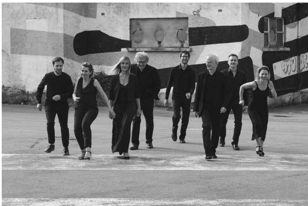
Les membres de United Instruments of Lucilin en route pour la Philharmonie – rendez-vous le 20 février à 19h30h à Luxembourg-ville.

10h. Aschreiwung erfuerderlech: eltereforum.marnach@men.lu