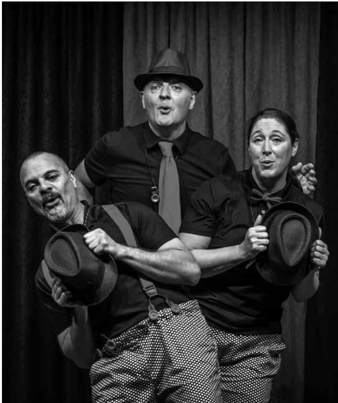
„Fir laachen, dréckt dräi“, heescht den neie Programm vun den Tri2pattes. E Samschdeg, de 24. Februar geet et um 20 Auer lass an der Schungfabrik zu Téiteng.

von Alexandra Szemerédy und Magdolna Parditka, Saarländisches Staatstheater, Saarbrücken (D), 17h. Tel. 0049 681 30 92-0. www.staatstheater.saarland