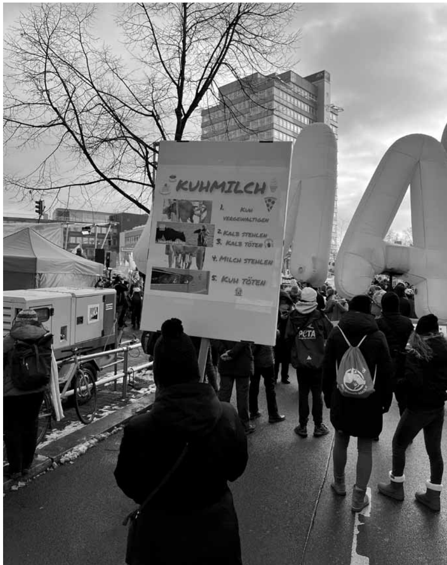
Findet unser letzter linker Kleingärtner gar nicht gut: Mitglieder der Tierschutzorganisation „Peta“ auf der Demo des Bündnisses „Meine Landwirtschaft“ am 21. Januar in Berlin.

Zwar ist das Bündnis eine Plattform der Agraropposition in Deutschland, löst sich aber nicht von den staatlicherseits vorgegebenen Rahmenbedingungen. Dieser stille Gehorsam – Kritik ja, grundlegende Veränderung nein – ist der nicht abgesprochene Konsens der beiden Lager. Einerseits entwickelt man gute Ökopolitionen: für eine Landwirtschaft, die sich an Kreisläufen orientiert, die Kennzeichnung von Gentechnik, den freien Zugang von Bauern und Bäuerinnen zu Ackerland und Saatgut. Man versäumt auch nicht zu erwähnen, dass „unsere“ Agrarpolitik global Hunger produziert. Doch während man