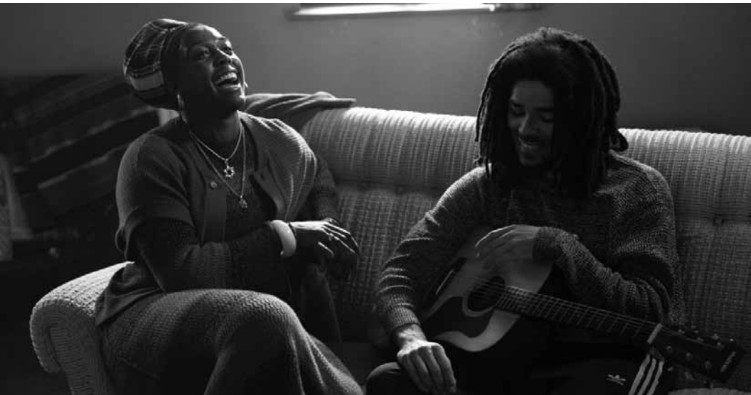
Neu in den Kinos: „Bob Marley – One Love“, Spielfilm von Reinaldo Marcus Green über die Musiklegende Bob Marley.