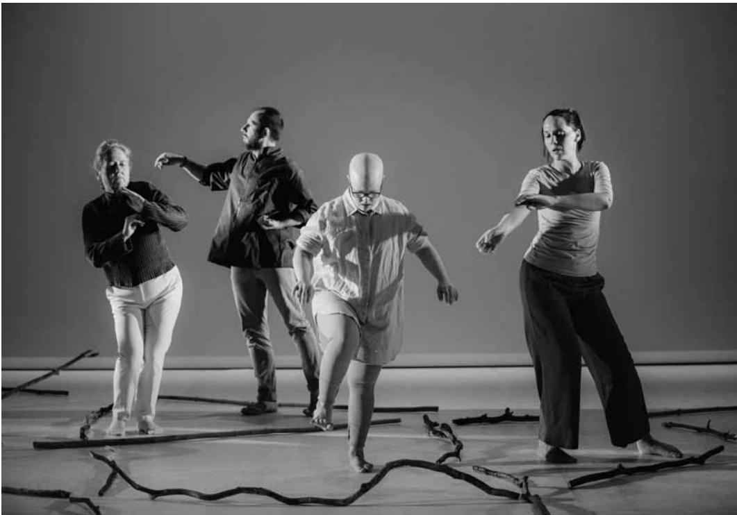
Tanz und Inklusion : In „Re V Ivre – Erwachen/Leicht zu Lesen“ von Annick Pütz und Giovanni Zazzera treffen auf der Bühne Menschen mit und ohne Behinderung aufeinander – am 22. und am 23. März jeweils um 20 Uhr sowie am 24. März um 17 Uhr im Mierscher Kulturhaus.

Alle Rezensionen zu laufenden Ausstellungen unter/Toutes les critiques du woxx à propos des expositions en cours : woxx.lu/expoaktuell