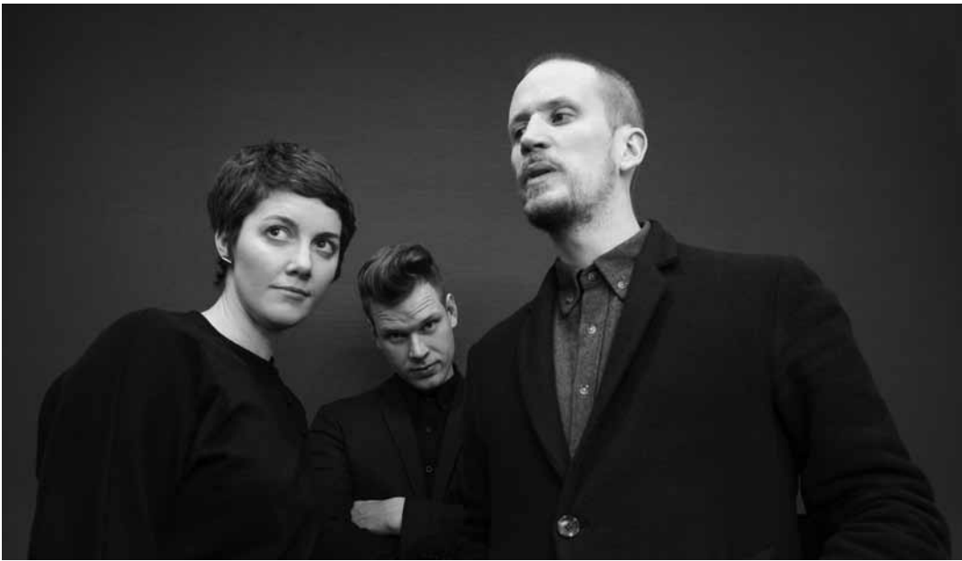
Punkt.Vrt.Plastik begeistert an diesem Freitag, dem 29. März um 19:30 Uhr in der Philharmonie mit ihrer einzigartigen Verschmelzung von elektronischen und akustischen Klängen.