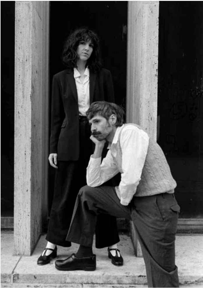
Widowspeak verzaubert an diesem Sonntag, dem 31. März um 20:30 Uhr das Publikum in den Rotondes mit einem fesselnden Dream-Pop-Sound und hypnotisierenden Melodien.

Unexpected #1: Gegen die Stigmatisierung von LGBTQIA+-Identitäten: Verschiedene Strategien? Mit Elona Dupont und Nada Negraoui, Kinosch, Esch , 17h30. www.kulturfabrik.lu Einschreibung empfohlen: inscriptions@kulturfabrik.lu