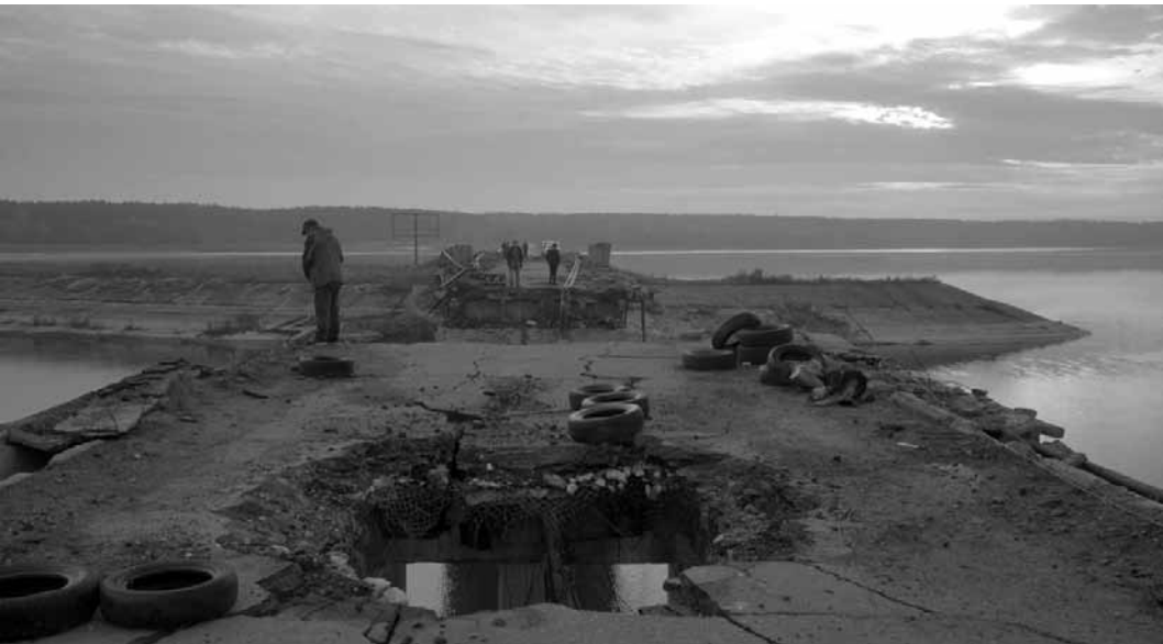
Einen eindringlichen Blick auf den Ukraine-Konflikt bietet der Dokumentarfilm „Intercepted“ am Donnerstag, dem 13. Juni um 20:30 Uhr in der Cinémathèque.

Vélocité - La vallée des champion-nés exposition sur 100 ans de cyclisme, musée Ferrum (14, rue Pierre Schiltz), du 7.6 au 29.9, je. - di. 14h - 18h.