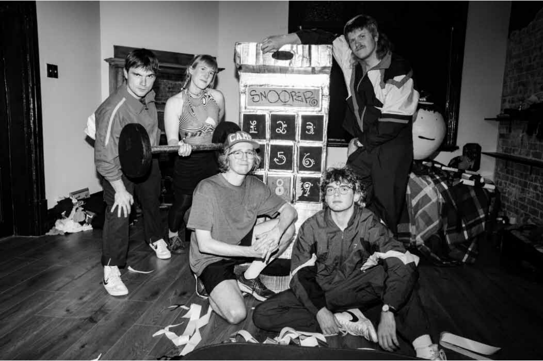
Snöoper, das explosive Punk-Debüt, ist am 12. Juni um 20:30 Uhr live in den Rotondes zu erleben.