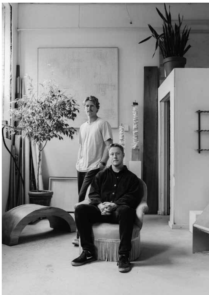
Sie sind sowohl Autoren und Komponisten als auch Interpreten: Das Indie-Folk-Duo „Hollow Coves“ spielt am 12. April im Opderschmelz in Dülklingen.