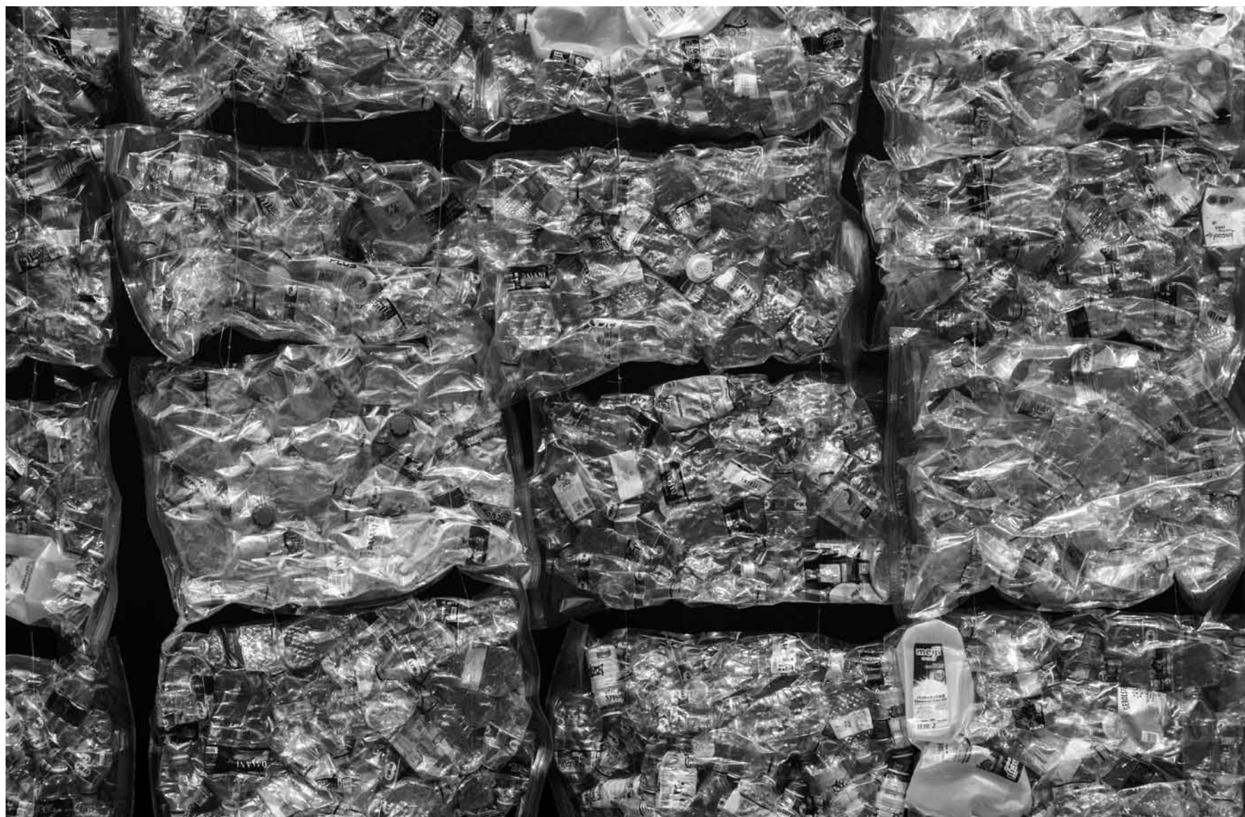
PET-Flaschen sind jener Kunststoffmüll, der sich am Besten recyceln lässt. Allerdings macht PET nur fünf Prozent der Kunststoffproduktion in Europa aus.

Die Vermeidung von Abfällen sollte also an erster Stelle stehen, weswegen die Umweltverwaltung gemeinsam mit Valorlux eine Arbeitsgruppe auf die Beine gestellt hat, die Projekte wie die wiederverwendbare „Ecosac“, das Gemüsenetz „Superbag“ oder das Mehrweg-Kaffeebechersystem „Spin“ ausarbeitet. Der „Ecosac“ ist ein Erfolg, auch wenn er von vielen Menschen wohl nicht nur zum Einkaufen verwendet wird – das Projekt wurde auf EU-Ebene als „best practice“ ausgezeichnet. Auch die Luxemburger Gesetzgebung bietet einige Maßnahmen zur Reduktion von Plastik, wie das Umweltministerium betont: Verbot von verschiedenen Einwegprodukten, sowohl im Verkauf als auch für Restaurants und Feste, außerdem dürfen verschiedene Obst- und Gemüsesorten seit dem 1. Januar 2023 nicht mehr in Kunststoff verpackt werden, wenn das Gewicht unter anderthalb Kilo liegt.