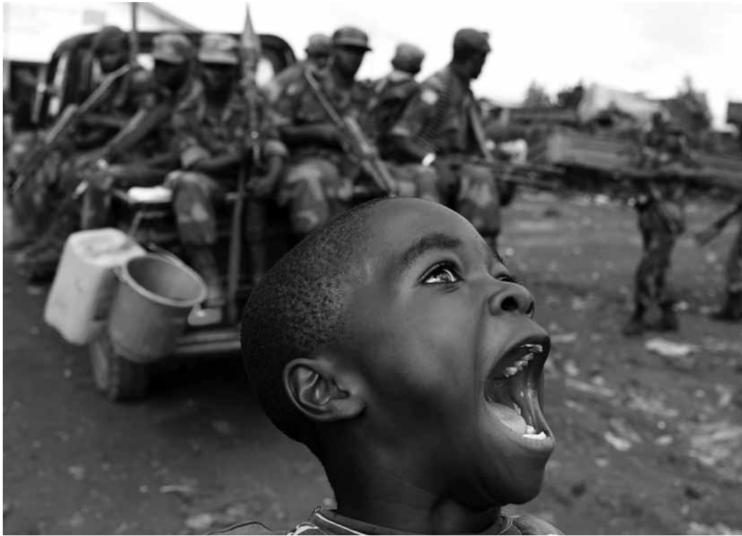
À ne pas manquer : Goran Tomasevic a été présent sur tous les fronts. Ses photographies marquées par un humanisme de proximité et une humilité évidente témoignent les histoires qu'il a rencontré au fil de sa carrière. À l'Arsenal à Metz.

Orchestre national de Metz Grand Est, sous la direction de Théotime Langlois de Swarte, œuvres de Monteverdi et Vivaldi, Arsenal, Metz (F), 18h. Tél. 0033 3 87 74 16 16. www.citemusicale-metz.fr