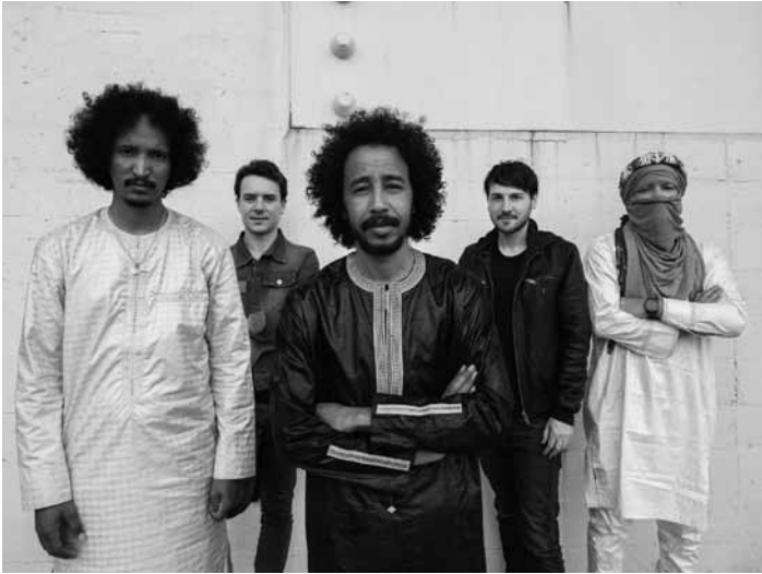
Mit hypnotischen Gitarrenriffs und pulsierenden Rhythmen entführen Tamikrest am Donnerstag, dem 23. Mai um 20 Uhr, im Wiltzer Prabbeli ihr Publikum in die Wüste.