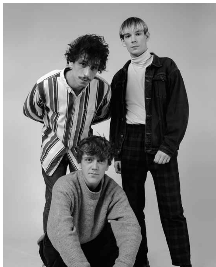
Inspiré de la new wave des années 80, Vipères sucrées salées joue le mardi 18 juin à 20h à la Kulturfabrik à Esch.

Die Entführung aus dem Serail , Singspiel in drei Akten von Mozart, unter der Leitung von Justus