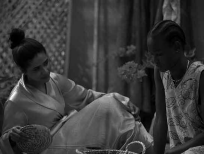
Zwei unterschiedliche Frauen in einem noch geeinten Sudan: „Goodbye Julia“. Neu im Utopia.

Sur un scénario de Buñuel et Dalí, des images folles, un film choc qui fut longtemps frappé d'interdiction et provoqua la parution du « Manifeste surréaliste ».