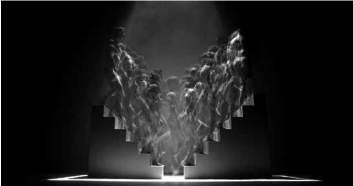
Die Choreographie „Khaos“ erkundet die Beziehung der Menschheit mit dem Chaos in einer multidisziplinären Performance. An diesem Samstag, dem 28. September im Mierscher Theater.

BAM ! 10 ans : Coco Boum Boum, piste de danse géante, rythmes