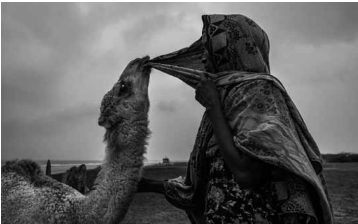
Dernière chance de voir l'exposition « Earth is not flat, but soon will be », avec entre autres des œuvres de Nichole Sobecki, au Neimënster.

de Salon Vol. 1 exposition collective, Kulturhaus Kopstal (6, rue de Mersch), du 5.10 au 6.10, sa. + di., 11h à 20h. Vernissage le 4.10 à 18h.