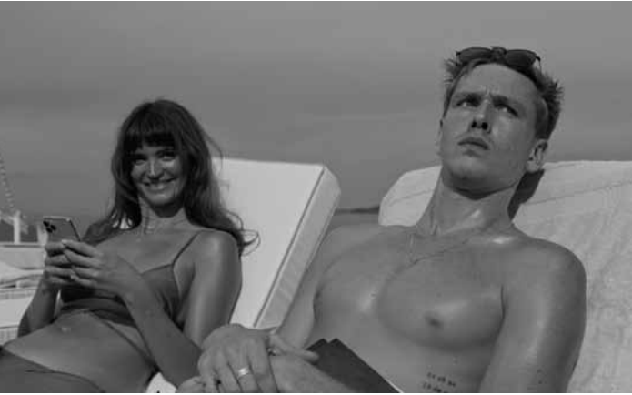
Die beiden Models Carl und Yaya nehmen kostenlos an einer Kreuzfahrt teil – weil die erfolgreichere Yaya auch Influencerin ist.

Matrimonio all'italiana (Mariage à l'italienne) I 1964 de Vittorio De Sica. Avec Sophia Loren, Marcello Mastroianni et Aldo Puglisi. 100'. V. fr. Me, 2.10., 20h30.