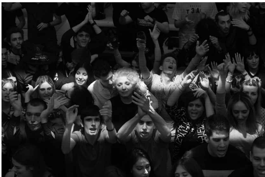
In „Mother Mara“ zerbricht das Leben einer Mutter durch den plötzlichen Tod ihres Sohnes. Im Kinepolis Belval und im Utopia.