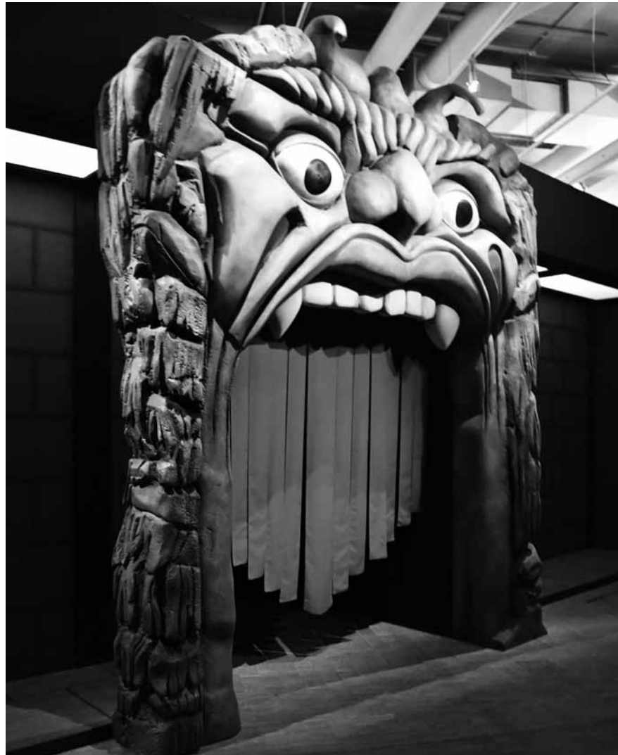
L'entrée de l'expo « Surréalisme » se fait par une bouche géante qui rappelle les fêtes foraines, dont les surréalistes étaient fêru-es.