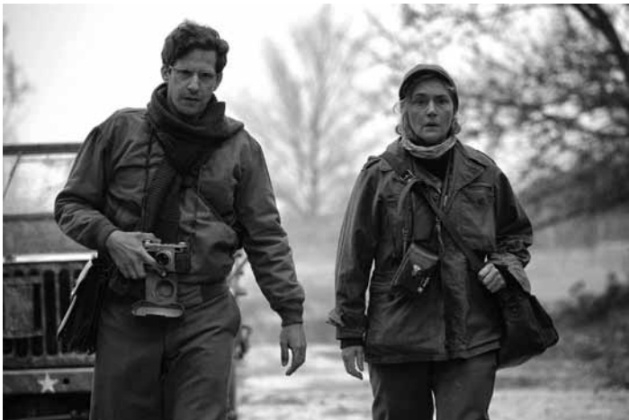
Die bewegende Lebensgeschichte von Lee Miller, einer talentierten Fotografin und Kriegsreporterin, die das Grauen und die Hoffnung in Zeiten des Konflikts festhielt: „Lee“ – neu im Kinepolis Kirchberg, Kinoler, Orion, Prabbeli, Scala, Starlight und Sura.