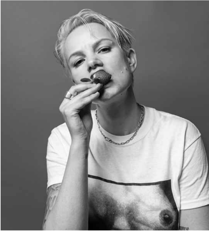
Enola verbindet rohen Post-Punk mit Grunge und Shoegaze. Am Mittwoch, dem 16. Oktober um 20:30 Uhr in den Rotondes.

Budapest Festival Orchestra , sous la direction d'Iván Fischer,