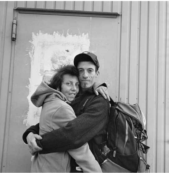
L'exposition « Les exclus du festin » présente les textes de Claude Frisoni et les photographies de Raymond Reuter, sensibilisant à la pauvreté au Luxembourg. Du 18 octobre au 5 janvier, au Musée Ferrum.

Oskar Holweck - Form und Textur. Retrospektive zum 100. Geburtstag Skulpturen, Moderne Galerie des Saarlandmuseums (Bismarckstr. 11-15. Tél. 0049 681 99 64-0), vom 12.10. bis zum 5.1.2025, Di., Do. - So. 10h - 18h, Mi. 10h - 20h. Eröffnung an diesem Fr., dem 11.10. um 19h.