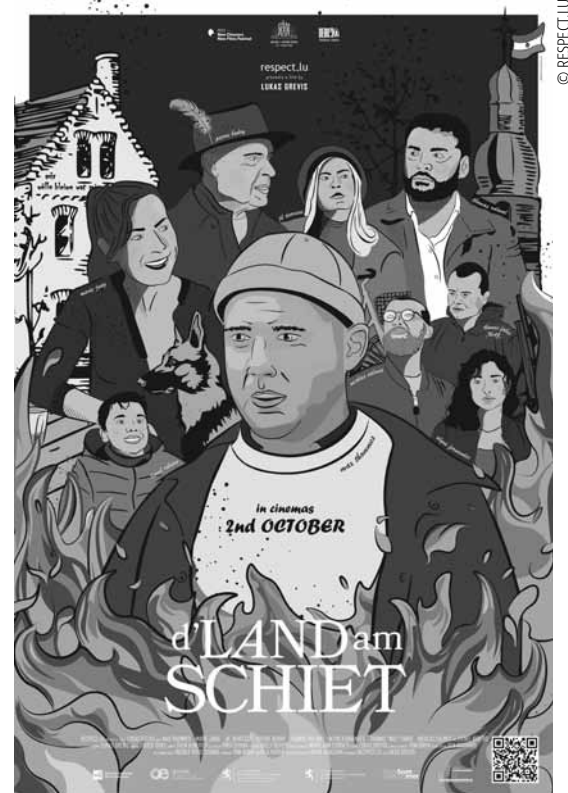
Die einen Dorfbewohner*innen wünschen sich Kontakt zu Flüchtlingen, die anderen möchten nichts mit diesen Menschen zu tun haben – eine souveräne Lösung des Konflikts ist nicht in Sicht.

In Le Paris, Orion, Prabbeli, Kinoler, Kulturhuef, Kursaal, Scala, Starlight, Waasserhaus und Utopia.