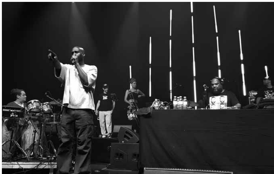
Posdnuos, Maseo et leurs musiciens sur la scène de la Rockhal, le 9 octobre, ultime date de leur tournée européenne.

Mais le spectacle n'a rien d'une visite au musée menée par des vétérans du rap sur le retour, dont le seul but serait de faire tourner le tiroir-caisse. Le scénario n'avait pourtant rien d'improbable. Depuis une bonne dizaine d'années, nombre de « papy » du rock et de la pop reforment leurs groupes pour des tournées au cours desquelles ils se contentent le plus souvent de décliner les best of de leurs répertoires, ne proposant rien de franchement neuf. Ces concerts revival font le bonheur d'un public autant enivré par l'alcool que par les succès musicaux passés, qui leur rappellent leur jeunesse. Pour les tourneurs et les artistes, cette recherche du temps perdu s'avère très profitable, et c'est d'ailleurs souvent la seule raison d'être de ces retours. L'annonce de la reformation d'Oasis, au mois d'août, en est la parfaite illustration, la promesse de gains gigan-