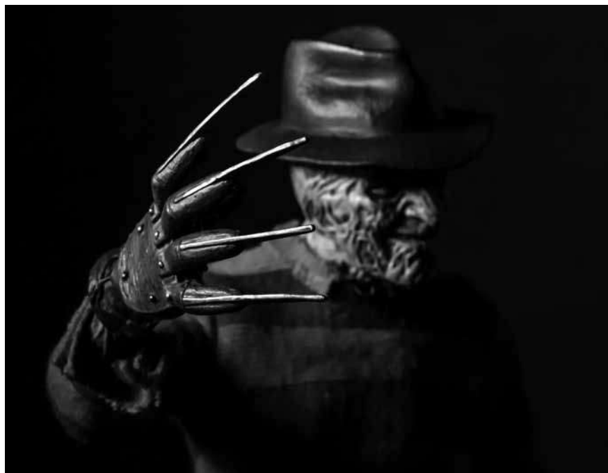
Ein kultiger Killer: Freddy Krueger.

Der Vortrag zu „Gender und Moral im amerikanischen Komödien- und Horrorkino“ findet an diesem Samstag, dem 19. Oktober um 10 Uhr im CNA (1b, rue du Centenaire) in Düdelingen statt. Der Eintritt ist kostenlos. Auf der Website www.cna.public.lu finden Sie alle wichtigen Informationen zu den kommenden Veranstaltungen.