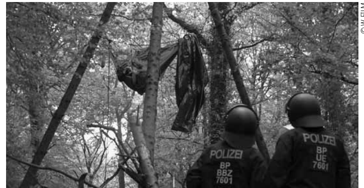
Das Anti-Atom-Netz Trier und die Waldbesetzung „Besch bleibt“ präsentieren am Mittwoch, dem 13. November um 19:30 Uhr im Broadway Filmtheater in Trier den Film „Vergiss Meyn nicht“, der die Frage aufwirft, wie weit Aktivismus gehen darf.

Déi kleng Hex , (> 4 Joer), Centre des arts pluriels Ettelbruck, Ettelbruck , 14h + 16h30. Tel. 26 81 26 81. www.cape.lu