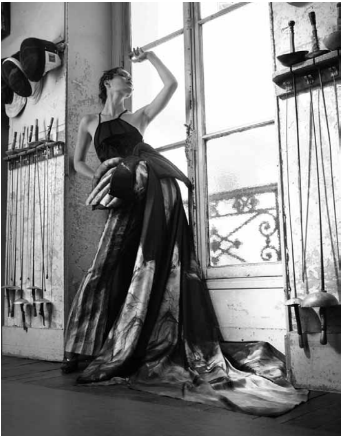
An diesem Samstag, dem 7. Dezember ist ab 18 Uhr im Rahmen der Langen Nacht der Kunst in Trier die multimediale Installation „KampfKunst“ von Sara Stubenbaum, untermalt von Live-Musik mit Eigenkompositionen, in der Galerie Netzwerk zu sehen.

et Alain Holtgen, Théâtre Le 10, Luxembourg, 20h. Tél. 26 20 36 20. www.theatre10.lu