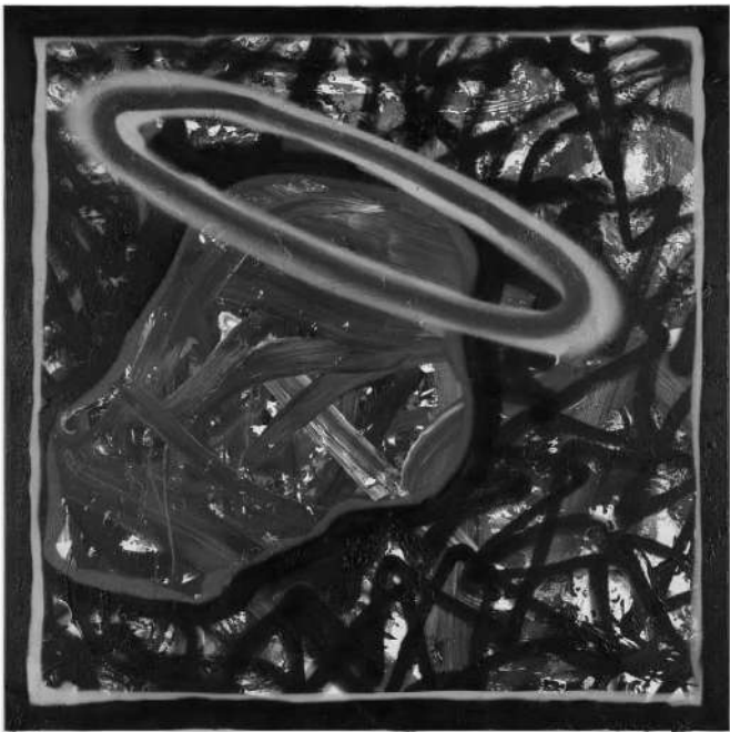
Les œuvres de Jim Peiffer à L'Orangerie de Bastogne explorent des mondes imaginaires où la peinture et la sculpture interrogent nos perceptions et nos rêves. À partir du 13 décembre.

Jim Peiffer : Faire et refaire des mondes pour se délivrer du Monde L'Orangerie, espace d'art contemporain (Pôle Culture, 2, pl. en Piconrue), du 13.12 au 2.3.2025, je. - di. 14h - 18h et sur rendez-vous. Vernissage le je. 12.12 à 18h30.