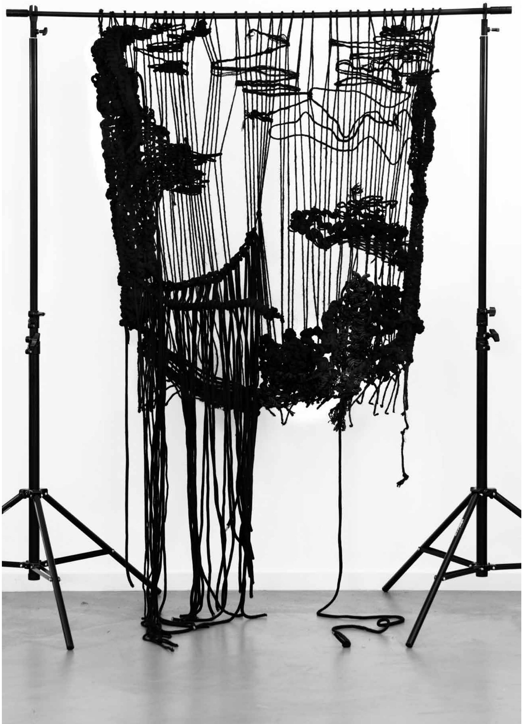
WERK VON ALESSIA BICCHIELLI.