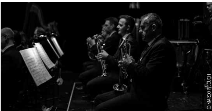
Das Philharmonische Orchester Trier präsentiert am Donnerstag, dem 9. Januar um 19:30 Uhr im Theater Trier „Games in Concert“ mit Soundtracks aus Videospielklassikern wie Tetris, GTA und World of Warcraft.