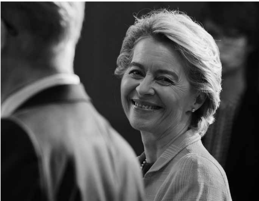
Ursula von der Leyen en visite à Francfort, en juin 2021.