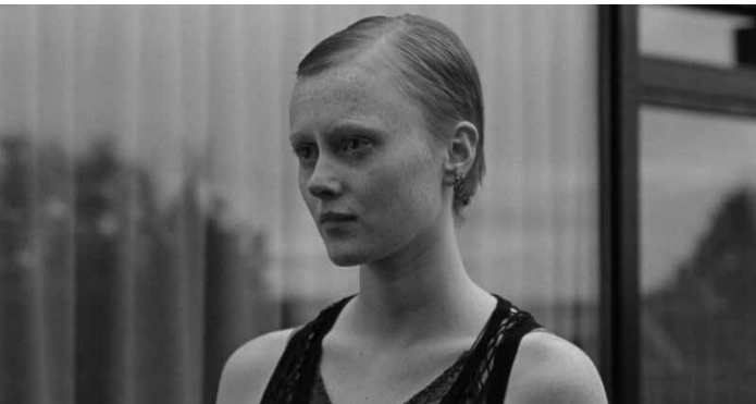
Ein schrecklicher Moment an einem Sommertag in Reykjavik erschüttert das Leben der Kunststudentin Una: „Ljósbröt“ neu im Utopia.

Marked Men USA 2025 von Nick Cassavetes. Mit Chase Stokes, Sydney Taylor und Ella Balinska. 93'. O.-Ton + Ut. Ab 12. Kinopolis Belval und Kirchberg, 21.2. um 19h. Die Medizinstudentin Shaw liebt den rebellischen Tätowierer Rule seit Jahren, obwohl sie ihn immer nur als Familienfreund betrachtet hat. Nach einer hemmungslosen Nacht sind die beiden gezwungen, sich verschüt- teten Gefühlen zu stellen und dabei Trauer, familiäre Erwartungen und Bindungsängste zu überwinden.