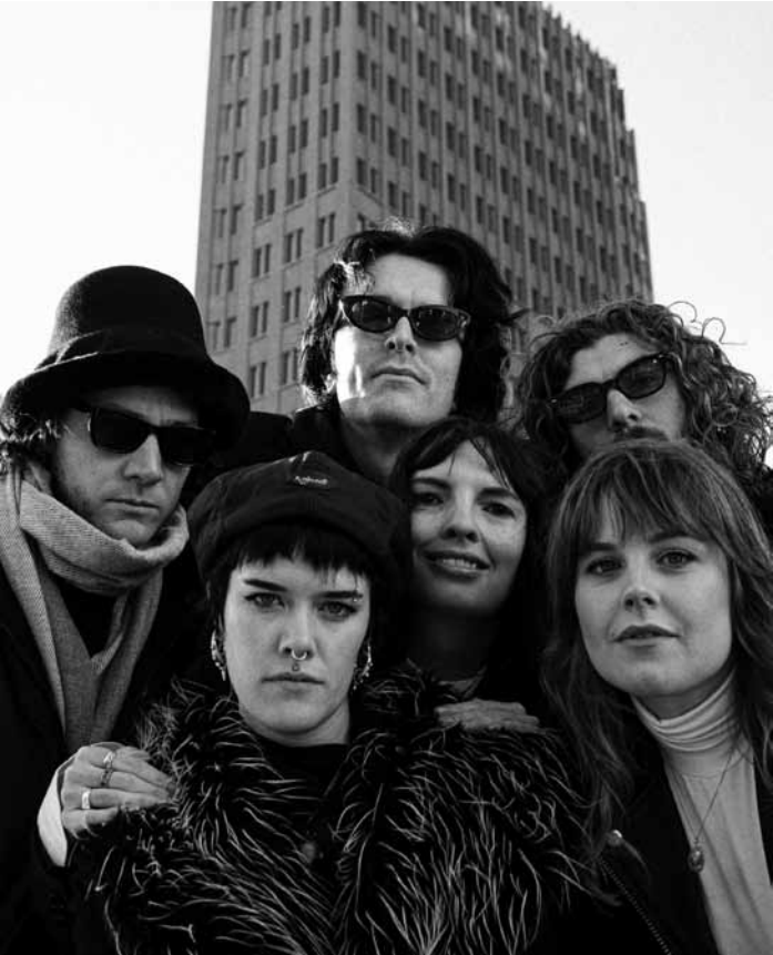
Die Musik der Band The Dharma Chain ist eine Mischung aus Shoegaze, 90er Garage und psychedelischen Klängen. Sie spielen am Freitag, dem 7. März um 20:30 Uhr in den Rotondes.

The Singing Circus , mit dem WDR-Rundfunkchor Köln und Schul- und Communitychören aus Luxemburg (10-18 Jahre), Philharmonie, Luxembourg , 11h. Tél. 26 32 26 32. www.philharmonie.lu