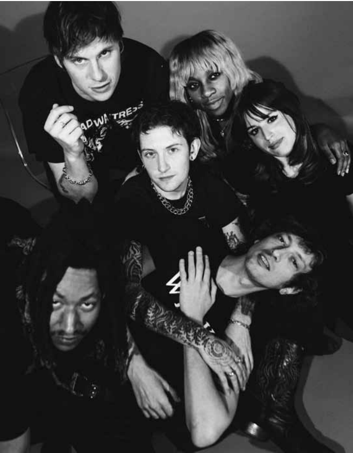
Die Indie- und Post-Punk-Band Tvod aus Brooklyn kommt am Mittwoch, dem 28. Mai, um 20:30 Uhr in die Rotondes.