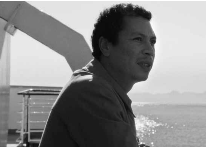
Pendant une dizaine d'années, « La mer au loin » suit Nour, qui a émigré clandestinement à Marseille.

The Goonies REPRISE USA 1985 de Richard Donner. Avec Sean Astin, Josh Brolin et Jeff Cohen. 90'. V.fr. À partir de 6 ans. Kinopolis Belval und Kirchberg, 24.5 à 17h. Les Goonies sont un groupe d'amis qui vivent dans la ville d'Astoria, mais leurs maisons ont été achetées et vont être démolies. Cependant, ils vivront leur dernière aventure à la