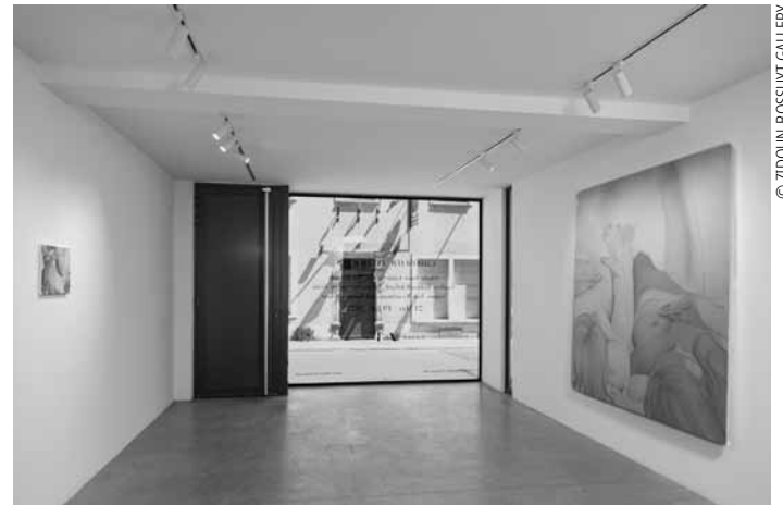
In der Zidoun-Bossuyt Gallery ist die Gruppenausstellung „Chromatic Intimacies“ noch bis zum 19. Juli zu sehen.

Chromatic Intimacies , Gruppenausstellung, Werke u.a. von Ghada Amer, Louis Granet und Asa Jackson, Zidoun & Bossuyt Gallery (6, rue Saint-Ulric. Tél. 26 29 64 49), bis zum 19.7., Di. - Fr. 10h - 18h, Sa. 11h - 17h.