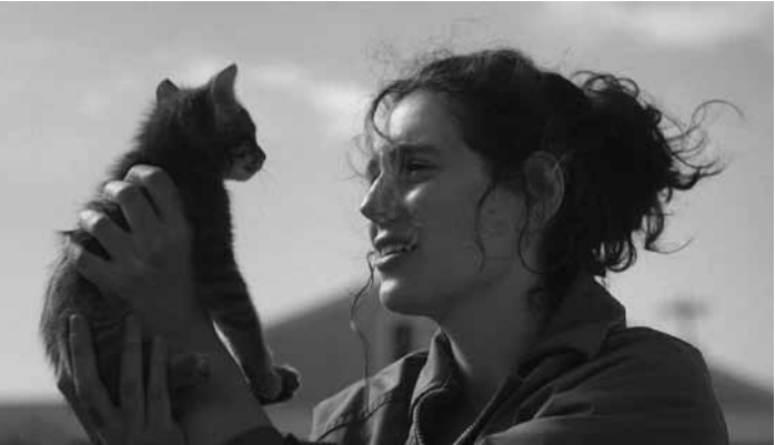
In dem Film „Sorry, Baby“ versucht eine junge Akademikerin, einen sexuellen Übergriff zu verarbeiten. Neu im Utopia.