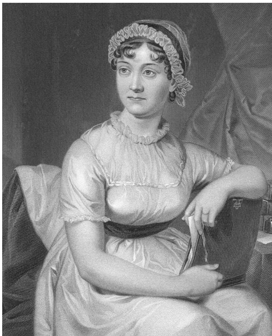
Portrait de Jane Austen, d'après une esquisse au crayon réalisée par sa sœur Cassandra vers 1810.