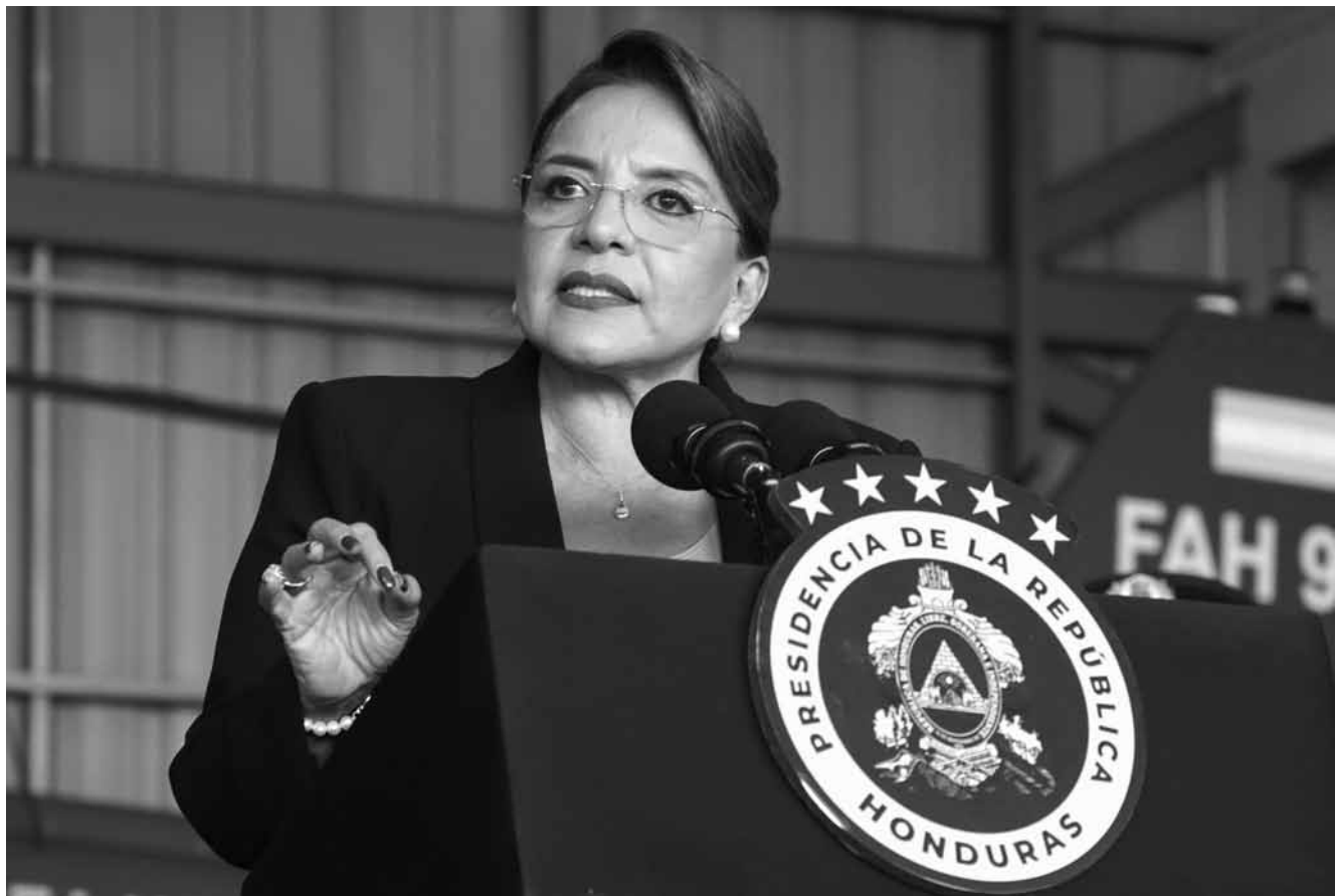
Hat viele Hoffnungen in sie enttäuscht: die honduranische Präsidentin Xiomara Castro Ende Juni während einer Rede in der Hauptstadt Tegucigalpa.