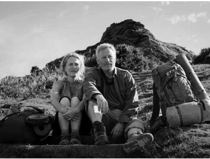
Nach mehreren Schicksalsschlägen begibt sich ein Paar auf eine lange Wanderung entlang der Küste Englands. „The Salt Path“: Neu im Kinopolis Belval und Utopia.

Y a pas de réseau F 2025 d'Edouard Pluvieux. Avec Gérard Jugnot, Maxime Gasteuil et Julien Pestel. 80'. V.o. À partir de 6 ans. Kinopolis Belval et Kirchberg Jonas et Gabi, âgés de 9 et 11 ans, passent le week-end avec leurs