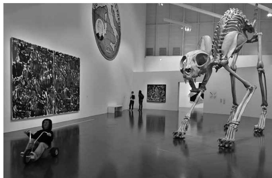
« Felix », un gigantesque squelette de chat à l'échelle d'un dinosaure, agit comme un trompe-l'œil.

Au même étage, le très commenté « Mur de l'atelier d'André Breton » rassemble 255 objets recueillis par l'artiste tout au long de sa vie. Il reflète l'essence-même de l'expo, celle où la diversité artistique se côtoie sereinement, tout en offrant une panoplie d'angles de cogitations. Il s'agit probablement du seul reproche que l'on s'autorise à faire, c'est-à-dire la ligne sans doute excessivement multidirectionnelle que l'exposition peut par moments prendre. En même temps, nous nous rendons compte du privilège qui nous est accordé d'avoir dans un même espace une myriade d'œuvres