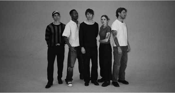
Die Band Turnstile präsentiert ihr neues Album „Never Enough“ am Montag, dem 23. Juni, um 20 Uhr in der Rockhal.

Reservierung erforderlich via www.cid-fg.lu Regional Maacher Musekschoul: Kazemusik , Kannermusical, Centre culturel, Grevemacher , 17h. www.machera.lu