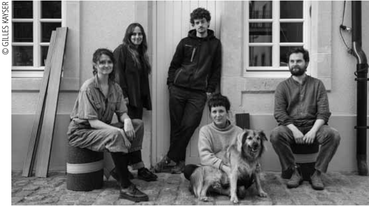
Le public est invité à découvrir la résidence d'artistes au Bridderhaus lors de l'OpenHaus, le samedi 28 juin dès 15 h.