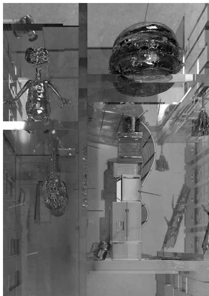
L'exposition « Hot Flashes » de l'artiste belgo-luxembourgeoise Aline Bouvy, présentée du 21 juin au 12 octobre au Casino Luxembourg, interroge l'expérience de l'enfance comme étape de construction sociale et politique.

Lisières vivantes. Vers une architecture de la cohabitation exposition collective, œuvres de Husos arquitecturas, Filips Stanislavskis, Superstudio, ..., Luxembourg Center for Architecture (1, rue de la Tour Jacob. Tél. 42 75 55), du 27.6 au 31.10, ma. - ve. 12h - 18h + sa. 14h - 18h. Vernissage le je. 26.6 à 18h.