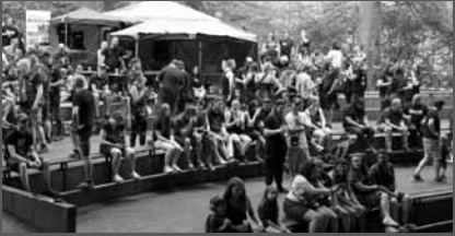
Cooler Location, höllisches Programm: das Rotten Stones Festival im Amphitheater Breechkaul, hier im vergangenen Jahr.