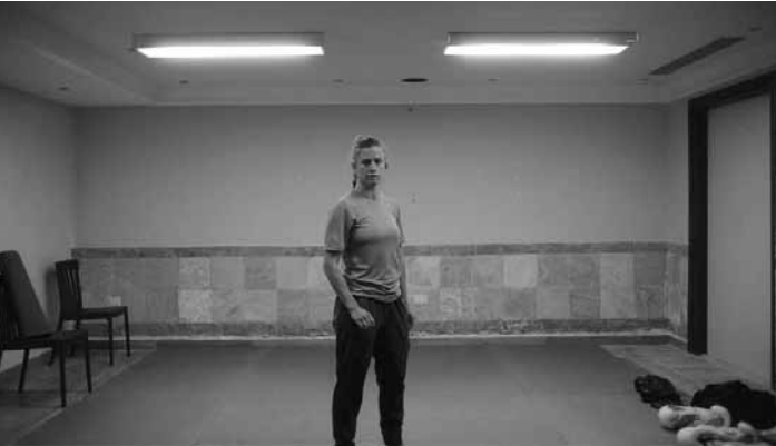
Eine ehemalige Kampfsportlerin wird engagiert, um drei wohlhabende jordanische Schwestern zu trainieren. Mond: Neu in fast allen Sälen.

En 2025, une trentaine de personnes issues d'une même famille apprennent qu'elles vont recevoir en héritage une maison abandonnée depuis des années. Quatre d'entre eux, Seb, Abdel, Céline et Guy, sont chargés d'en faire l'état des lieux. Ils vont alors se retrouver sur les traces d'une mystérieuse Adèle qui a quitté sa Normandie natale à l'âge de 20 ans pour se retrouver à Paris en 1895, au moment où la ville est en pleine révolution industrielle et culturelle.