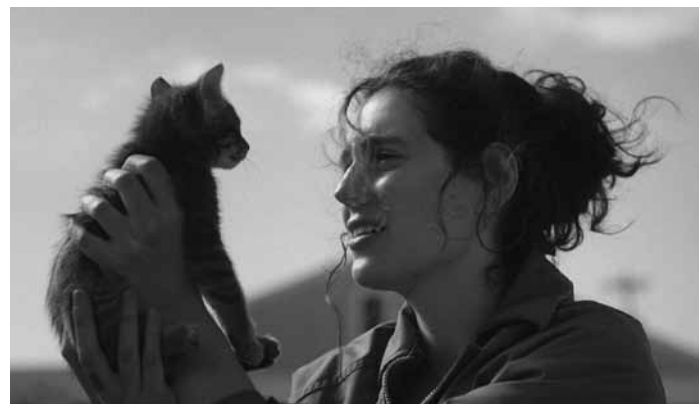
In dem Film „Sorry, Baby“ versucht eine junge Akademikerin, einen sexuellen Übergriff zu verarbeiten. Neu im Utopia.

Agnes, eine Hochschulprofessorin, kämpft mit den Folgen eines sexuel-