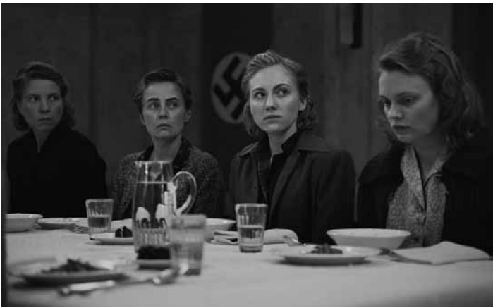
„Le assaggiatrici“ erzählt die Geschichte einer Frau, die Hitlers Essen vorkosten musste. Neu im Kinepolis Belval und Utopia.

Mit der Zeit entwickelt sich zwischen ihr und den anderen Vorkosterinnen eine Freundschaft.