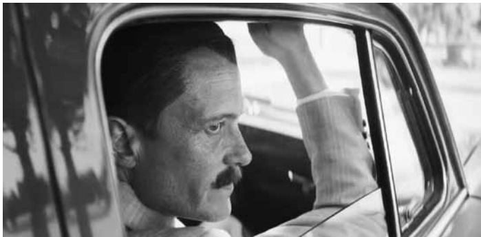
„Das Verschwinden des Josef Mengele“ zeichnet die Fluchtstationen des KZ-Arztes nach – von Argentinien über Paraguay bis nach Brasilien. Neu im Kinopolis Belval und Utopia.

Das Verschwinden des Josef Mengele D/USA/E/MEX/UK/F 2025 von Kirill Serebrennikov. Mit August Diehl,