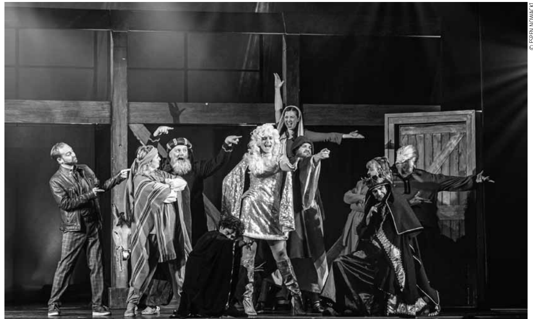
Das Rockmusical „Die stille Nacht“ erzählt die Entstehungsgeschichte von Weihnachten auf neue Weise – zu sehen am Donnerstag, dem 18. Dezember, um 20 Uhr im Artikuss.

Familljefestival Chrëschtdag: Chrëschtsaiten , Wantererzielung (2-5 Joer), Philharmonie, Luxembourg , 10h15, 11h, 11h45, 14h15 + 15h15. Tel. 26 32 26 32. www.philharmonie.lu