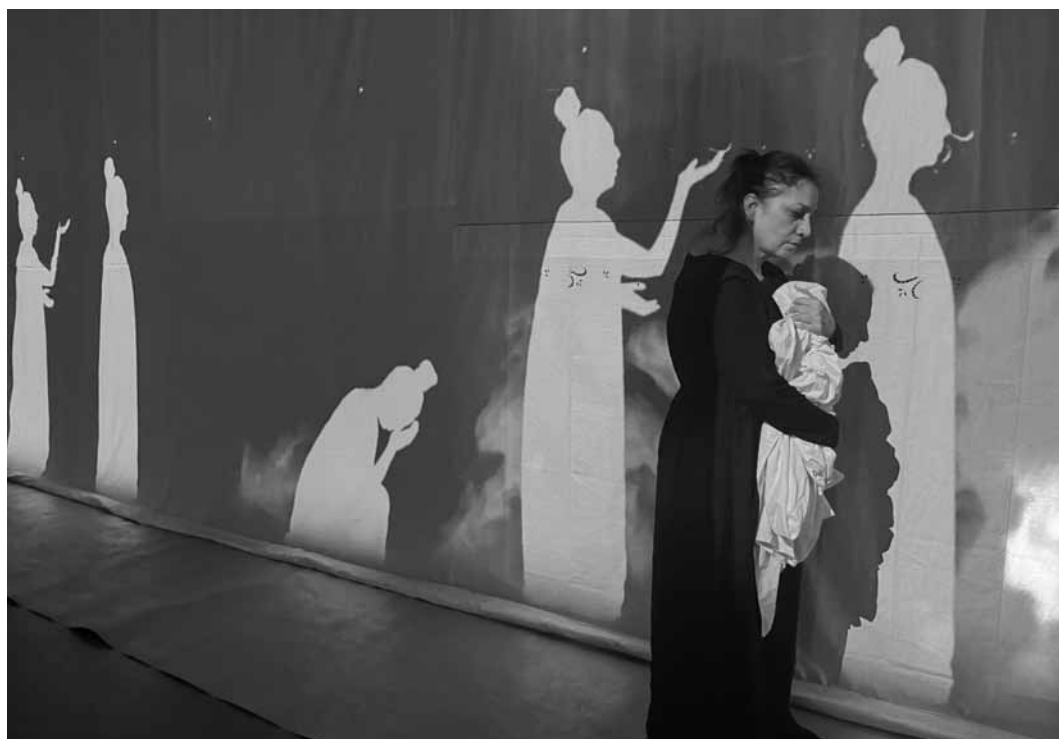
« Les traversées » est un spectacle théâtral d'initiation aux réalités de la guerre et à l'espoir porté par l'action humanitaire. Il sera joué le lundi 8 décembre à 14 h au numéro 10, cité Henri Dunant, à Bertrange.