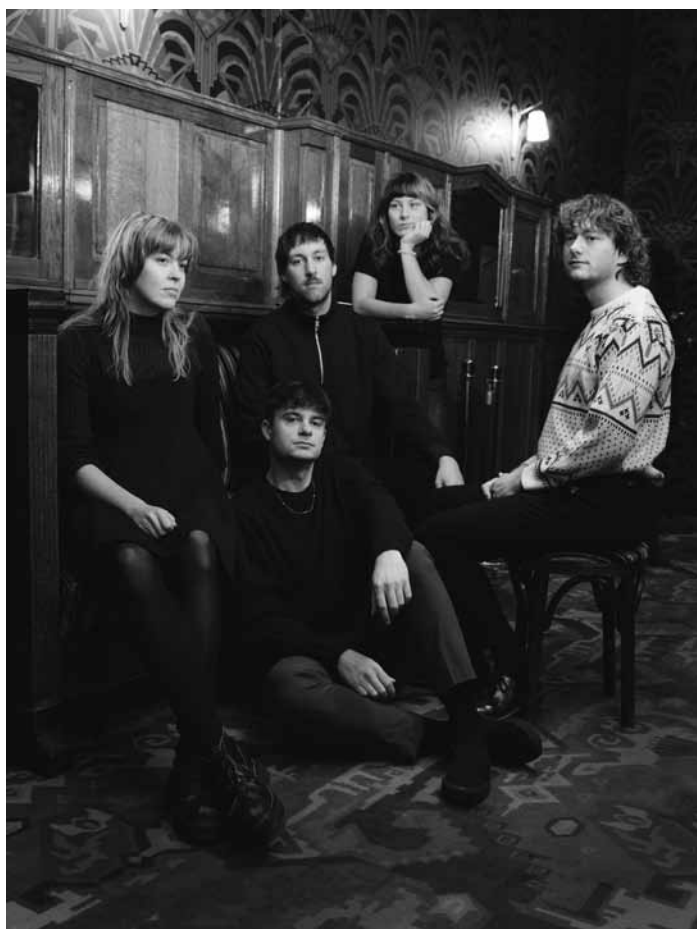
Die aus der Amsterdamer Underground-Szene hervorgegangene Band Marathon verwebt Post-Punk mit Shoegaze und Indie – und steht am Freitag, dem 12. Dezember, um 20:30 Uhr in den Rotondes auf der Bühne.

Jugendorchester der Groussbus-Waler Musek und Groussbus-Waler Musek , Kierch, Redange-sur-Attert , 20h. www.gwm.lu