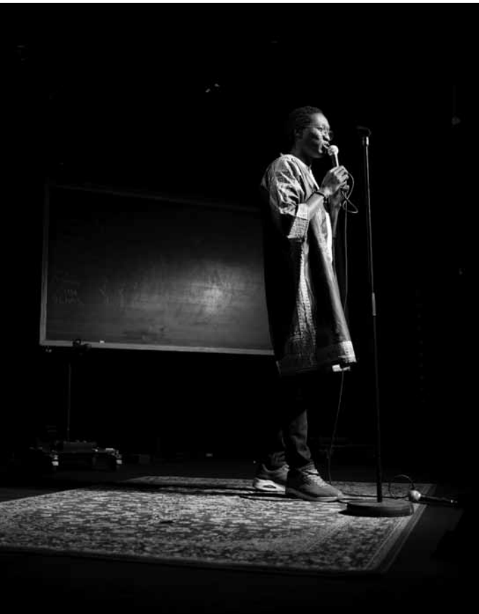
Bei der Lëtzebuenger Poetry Slam Meeschtersch e Samschdeg, de 17. Januar, um 20 Auer an de Rotondes, gëtt entscheet, wien Lëtzebuerg bei der Europa-meeschterschaft representéiert.

Villa creativa , ateliers pour familles, Villa Vauban, Luxembourg , 14h. Tél. 47 96 49 00. www.villavauban.lu Inscription obligatoire : visites@2musees.vdl.lu